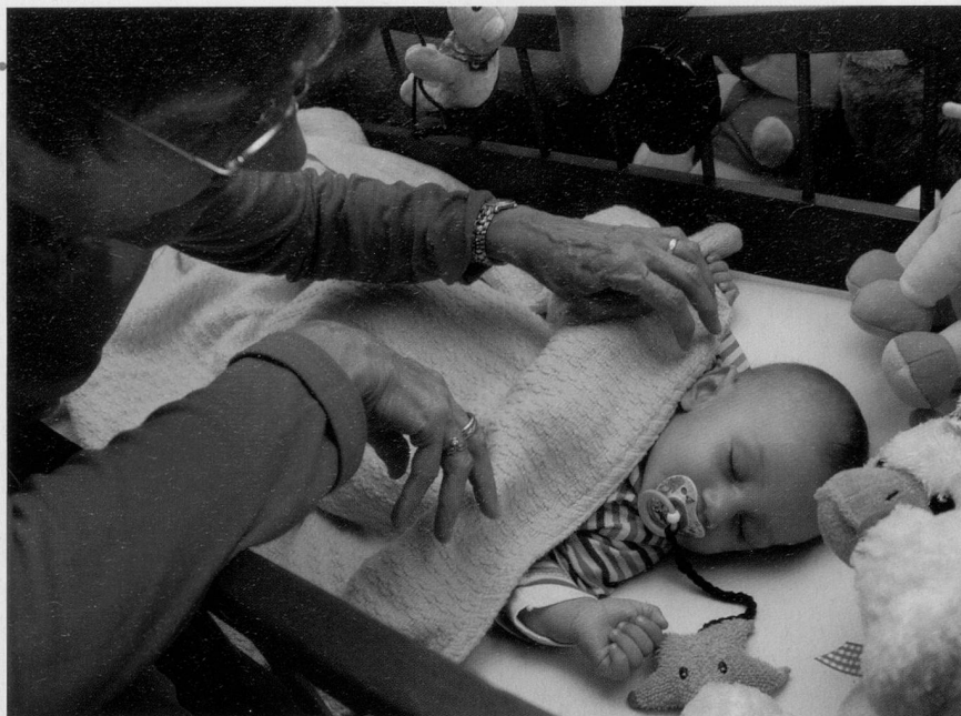
Babysitten, wenn die Eltern abends einmal ausgehen – eine Aufgabe, die viele Grosseltern übernehmen.