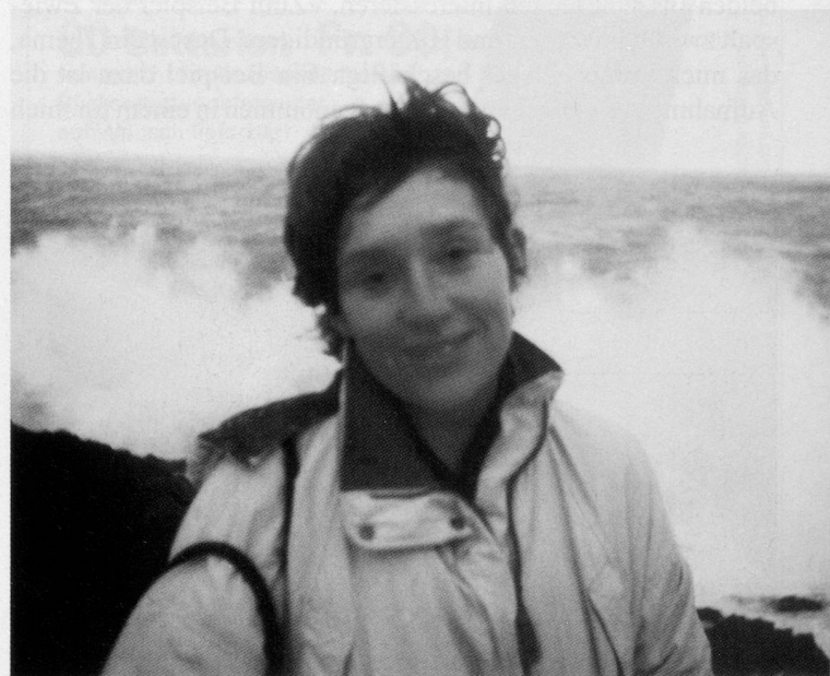
«Personen, die mich gut kennen, bemerkten spontan, dass die Bilder viel von mir ausdrücken.»

stehen, sich selbst, aber auch anderen gegenüber. Diese wäre nützlich, um endlich ein neues Altersbild in der Gesellschaft zu verankern.