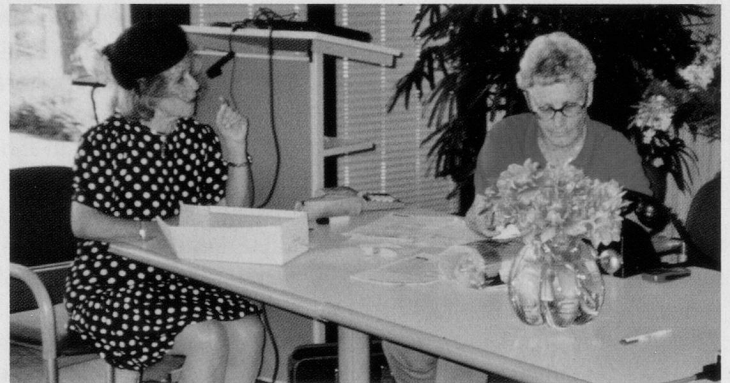
Die Freiwilligen des DC Pfannenstiel stellten sich in humorvollen Präsentationen gegenseitig ihre Arbeit vor. Im Bild: Steuerklärungsdienst.

Wir wurden ausführlich informiert. Auch die Studie war interessant.