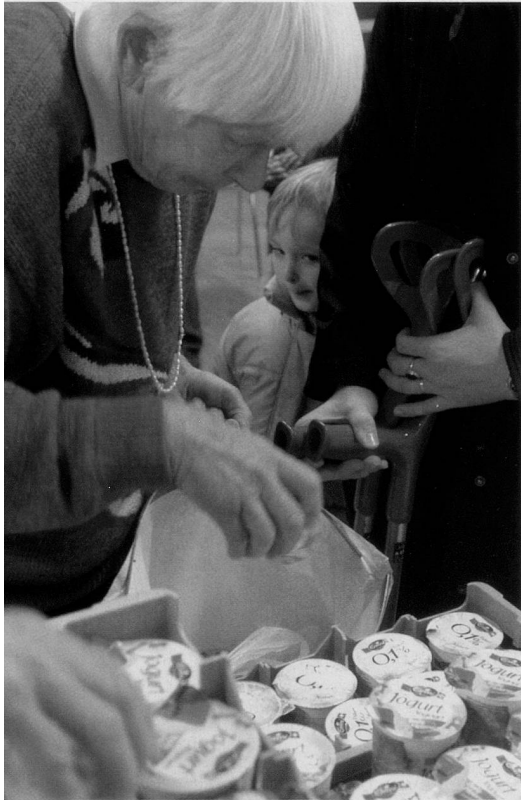
Lebensmittel von Tischlein deck dich helfen, das knappe Haushaltsbudget zu entlasten.

In finanzielle Not geratene Menschen sind froh, auf unkonventionelle Weise Artikel des täglichen Bedarfs zu erhalten. Seit Januar verteilt «Tischlein deck dich» in Affoltern a. A. Lebensmittel. Mittlerweile nutzen 22 Personen das Angebot. Sie unterstützen damit 90 Angehörige.