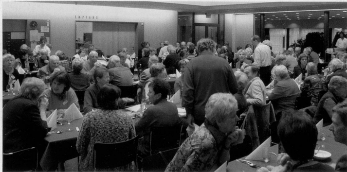
Freiwillige aus verschiedenen Bereichen (z. B. im Treuhanddienst oder als Senioren im Klassenzimmer) pflegten den Austausch und die Geselligkeit an den Freiwilligentreffen, hier im Alterszentrum Neumarkt in Winterthur.

(daw) Einmal im Jahr laden die Dienstleistungszentren die in ihrer Region tätigen Freiwilligen zu einem speziellen Anlass ein. Zwischen Anfang März und Anfang Mai wurden in sechs DCs solche Treffen organisiert, an denen die Freiwilligen informiert werden und sich austauschen können.