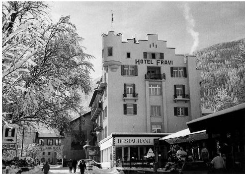
Das Hotel Fravi in Andeer wurde im 19. Jahrhundert erbaut.