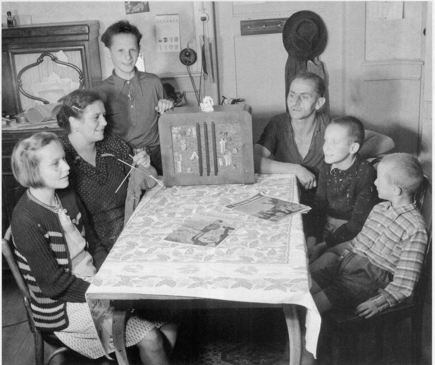
Das waren noch Zeiten!