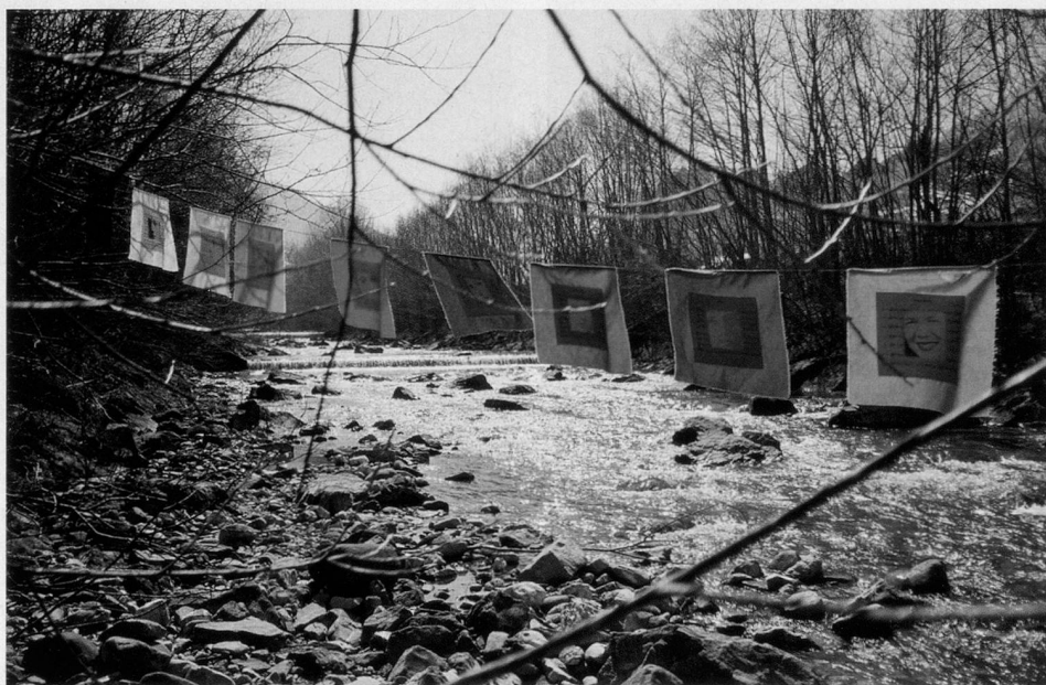
Das Leben bis zum Tod bewusst gestalten.

aus einer gesellschaftspolitischen Perspektive zu betrachten. Eine demokratische Gesellschaft muss darauf achten, dass auch ihre ältere Bevölkerung auf dem aktuellen Stand des Wissens ist und Entscheidungen mittragen kann.