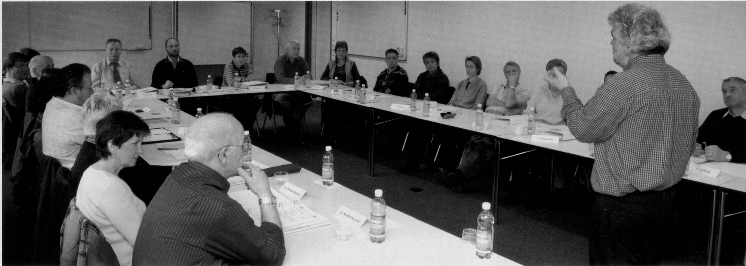
Die Pro Senectute führt das Seminar «Kurs auf die nachberufliche Zukunft» jährlich rund 200-mal durch.

Brügel im Verlauf des Kurses. «Sie verlieren nur eine Rolle – jene des Angestellten –, bleiben aber Partner, Grosseltern, Freund und so weiter.» Alle Pluspunkte auf der Bilanz, die man zu Beginn des Kurses erstellt habe, seien lediglich Optionen. «Es braucht Arbeit, sie zu realisieren.» Der Ruhestand, der keiner ist, verlangt also Aktivität in vielerlei Hinsicht. Diese Aussage ist nicht überraschend. «Vieles weiss man schon,