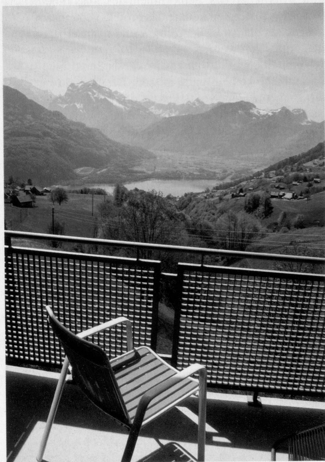
Der Blick schweift über den Walensee ins Glarnerland.