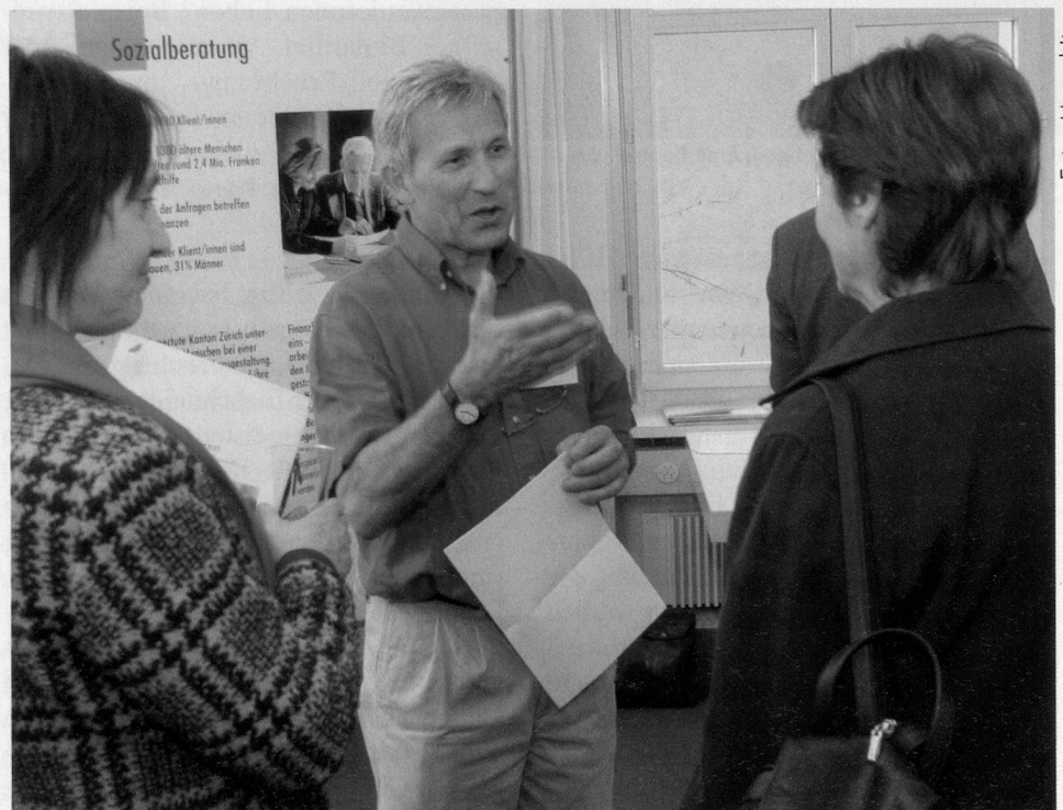
Am Open House der Geschäftsstelle konnte Pro Senectute Kanton Zürich das Gespräch mit rund 90 Gästen aus der Altersarbeit und dem Gemeinderat der Stadt Zürich aufnehmen.

Besucher/innen wurden auf mehreren Stockwerken über die vielseitigen Dienstleistungen informiert. Bei Fragen standen kompetente Ansprechpartner/innen aus den Kompetenzcentern und dem Dienstleistungscenter Stadt Zürich zur Verfügung.