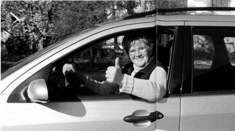
Demenzbedingte Hirnleistungsstörungen können das Verhalten im Strassenverkehr bereits in einem frühen Krankheitsstadium beeinträchtigen. Eine Kontrolluntersuchung zur Abklärung der Fahreignung kann entlastend sein.

Die Inhalte und die Umfänge der periodisch zu durchlaufenden verkehrsmedizinischen Abklärungen sind detailliert festgelegt. Das Kontrollinstrumentarium ist breit: gründliche Befragung, allgemeine klinische Untersuchung und Suche