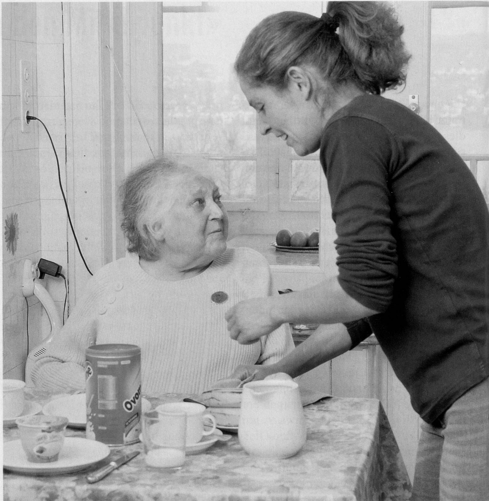
Dass immer dieselben Mitarbeiterinnen vorbeikommen, wird von den Kundinnen und Kunden sehr geschätzt.

«Das Wichtigste in meinem Beruf ist Einfühlung, gleichzeitig muss man Grenzen respektieren und wenn nötig auch setzen können.» Die Betreuung eines Kunden kann über Jahre dauern.