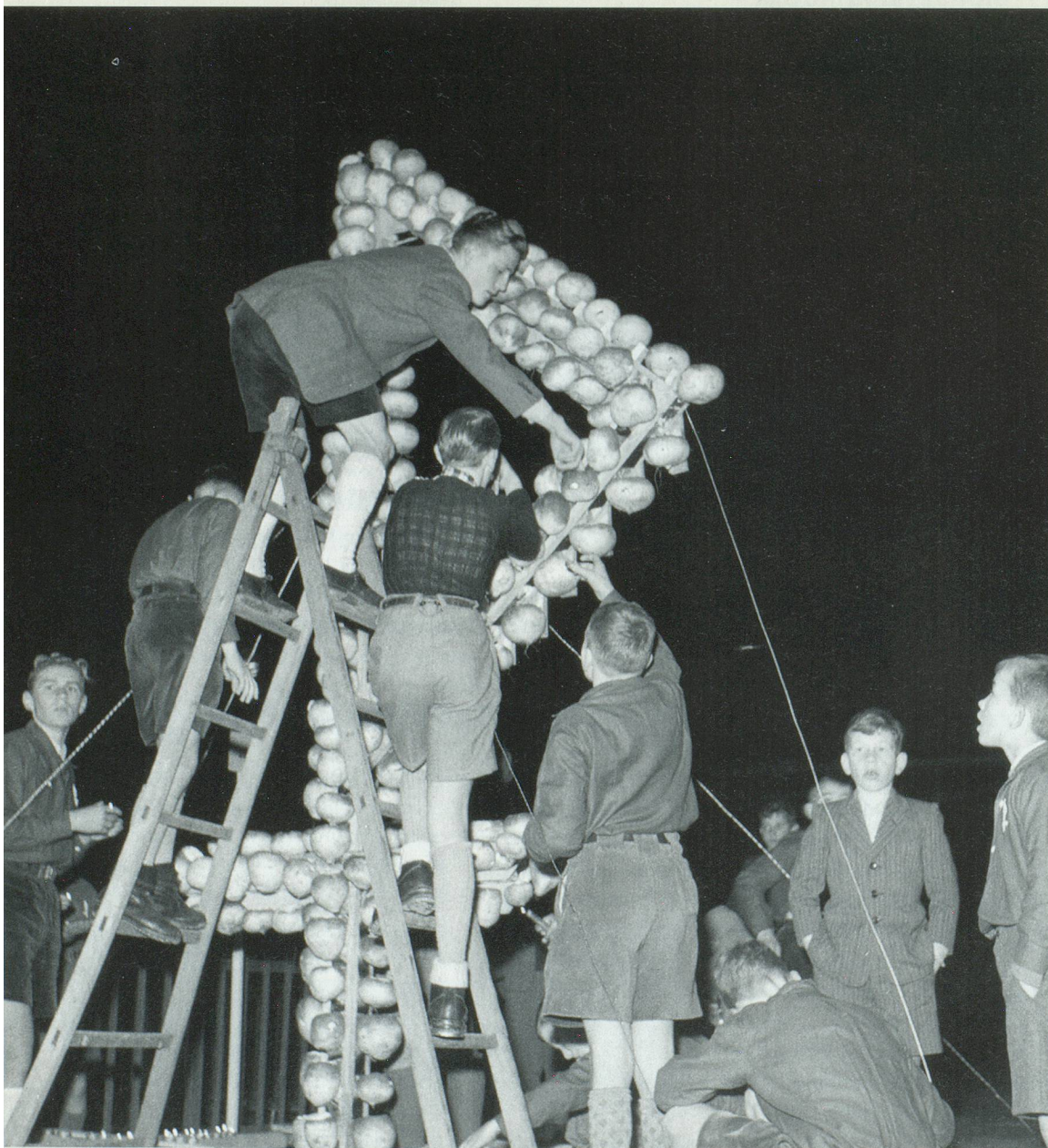
Ein seltsamer Zauber geht von den Räben aus.

Seit über hundert Jahren organisiert der Verkehrsverein Richterswil am zweiten Samstag im November die Räbechilbi. Dieser Brauch steht in Tradition mit verschiedenen Erntedankfesten im alemannischen Raum. Die ausgehöhlten und mit Schnitzereien verzierten Räben zieren oft auch Fenstersimse und Balkone. Früher waren die Räben Grundnahrungsmittel – heute werden sie fast ausschliesslich für die Räbenlichter angebaut.