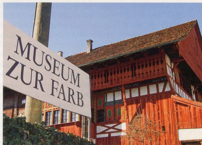
Wichtige Zeugen der industriellen Vergangenheit sind in Stäfa zu bewundern.