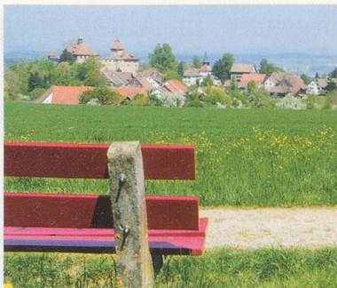
Wandern: Auf zur Kyburg 30