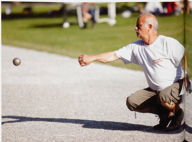
Die Josefswiese im Zürcher Kreis 5 ist seit Jahren Heimat für passionierte Pétanque-Spieler.