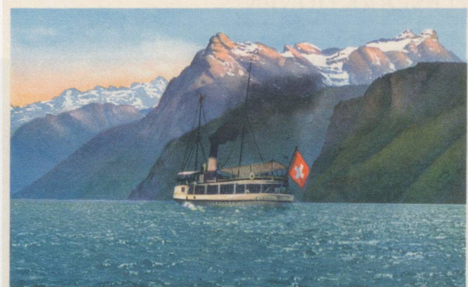
15202 Urnersee mit Urirotstock 2932 m

GRUSS vom RHEINFALL Liebe Freunde! Ich bin immer gerne da wenn Rheinfall für euch mit Liebe E. M. & Co.