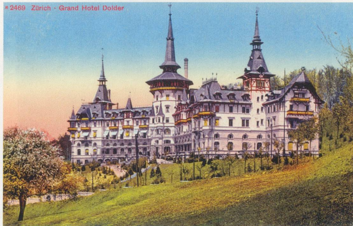
#2469 Zürich - Grand Hotel Dolder

Und ds Vreneli ab em Guggisbärg Und ds Simes Hans-Joggeli änet dem bärg S'isch äben e Mönsch uf Aerde Dass i möcht bi-n ihm si. U mah-n-er mir nit wärde – Simelibärg! – Und ds Vreneli ab em Guggisbärg Und ds Simes Hans-Joggeli änet dem Bärg – U mah-n-er mir nit wärde, vor Chummer stirben i.