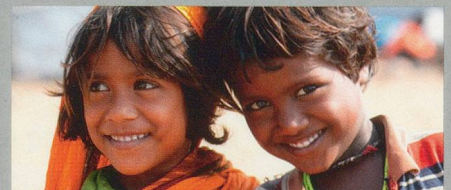
Unvergessliches Indien 19. November – 7. Dezember 2012 / 19 Tage

Arusha – Tarangire – Lake Manyara – Ngorongoro – Serengeti – Stonetown (Zanzibar) – Nordküste Zanzibar pro Person im Doppelzimmer ab CHF 8870.–