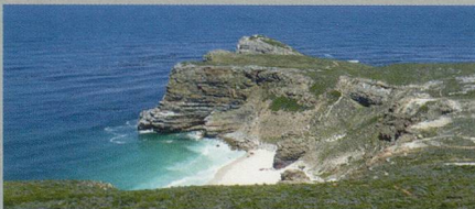
Faszination Südafrika 13. – 30. Oktober 2012 / 18 Tage

Johannesburg – Pretoria – Hazyview – Makalali Privat Game Reserve – Swaziland – Hluhluwe Nationalpark – Durban – Knysna – Oudtshoorn – Kapstadt – Kap der Guten Hoffnung pro Person im Doppelzimmer ab CHF 7650.–