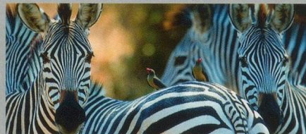
Tanzania – Zanzibar 28. Oktober – 12. November 2012 / 16 Tage

Johannesburg – Pretoria – Hazyview – Makalali Privat Game Reserve – Swaziland – Hluhluwe Nationalpark – Durban – Knysna – Oudtshoorn – Kapstadt – Kap der Guten Hoffnung pro Person im Doppelzimmer ab CHF 7650.–