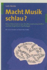
Lutz Jäncke: Macht Musik schlau? Huber, 2012