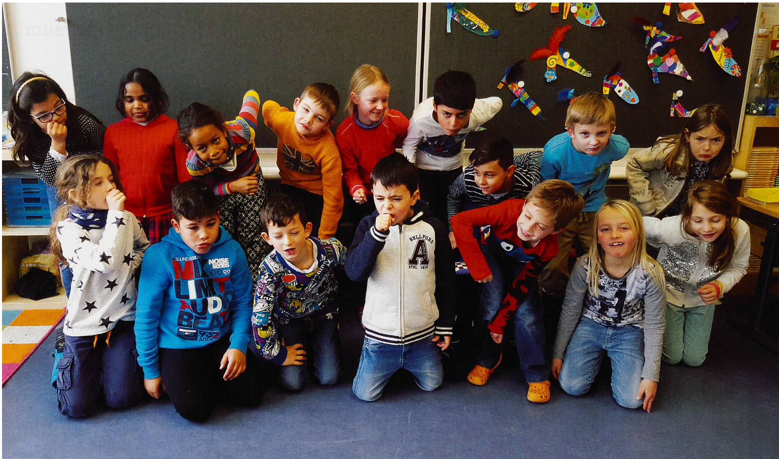
Die Zweitklässlerinnen und Zweitklässler posieren als «alte Leute» mit Gebrechen und Schmerzen.

SCHULPROJEKT Welches Bild haben Kinder von alten Menschen? Wie sehen sie sich selber als Alte? Kleine Künstler haben fürs VISIT gezeichnet.