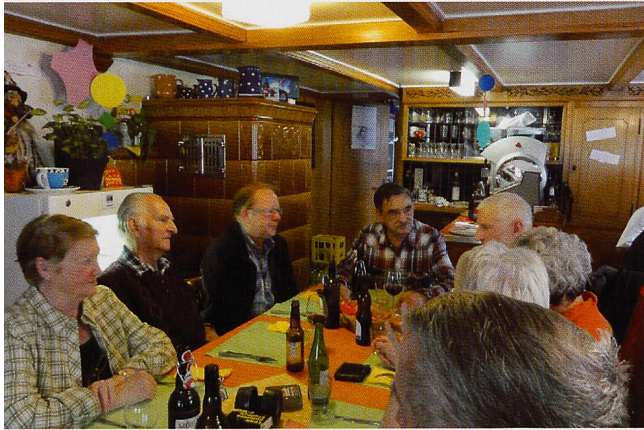
Im Gasthaus zur Kapelle lässt sich bestens rasten und sich austauschen – und notfalls aufwärmen.