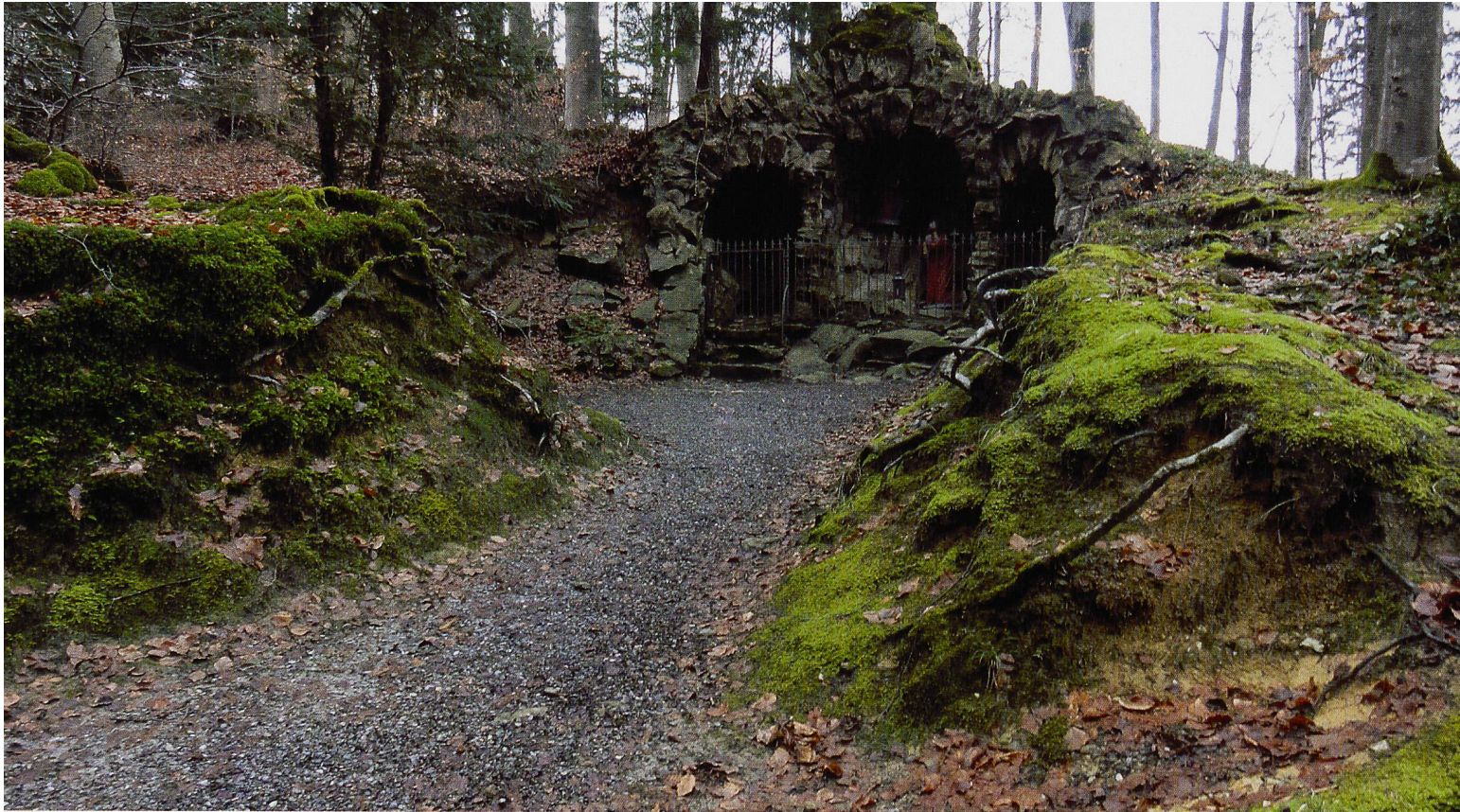
Eine der verschiedenen Grotten auf dem Benker Büchel ist die «Lourdesgrotte».

VON UZNACH NACH BENKEN Die Wandergruppe Schwerzenbach begibt sich auf die Spuren der Reformation und pilgert hinauf zu Maria Bildstein auf den Benkner Büchel. Eine Wanderung zwischen den Religionen.