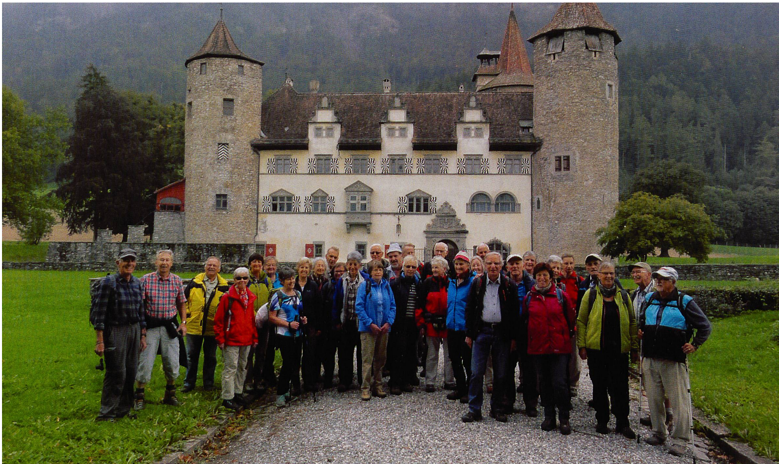
Auch wenn man das Schloss Marschlins nicht von innen sehen darf, ist es eine Augenweide: Fototermin mit der Wandergruppe.