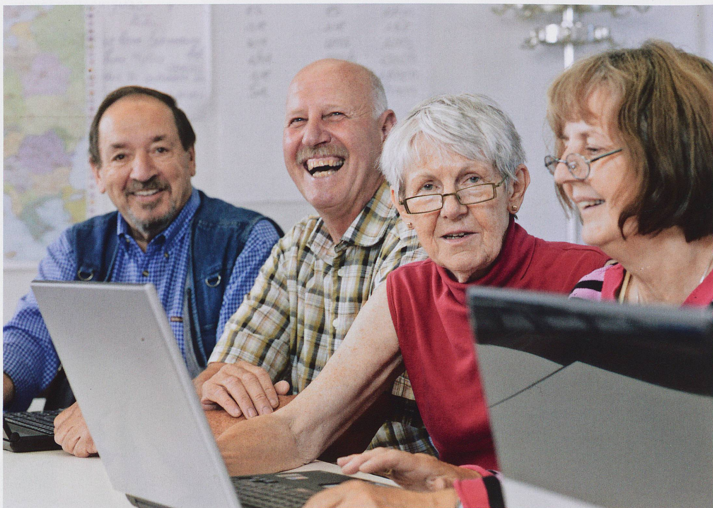
Die Partnerschaft mit der Klubschule Migros bringt viele Vorteile für unsere Kursteilnehmenden.