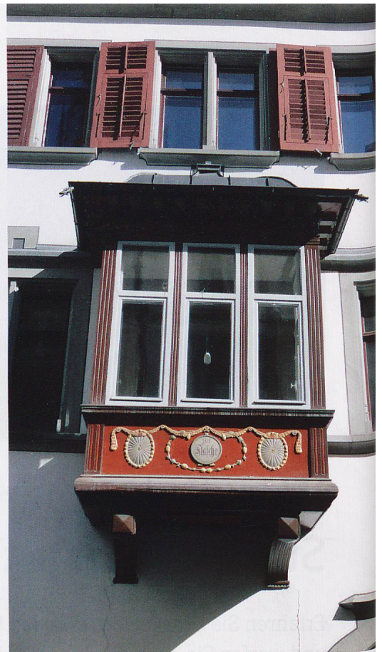
111 Erker mit individueller Geschichte gibt es in der Altstadt von St. Gallen.