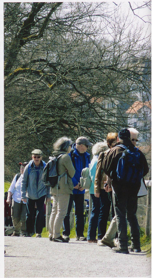
Die Wandergruppe auf dem Weg zu den «Drei Weieren».