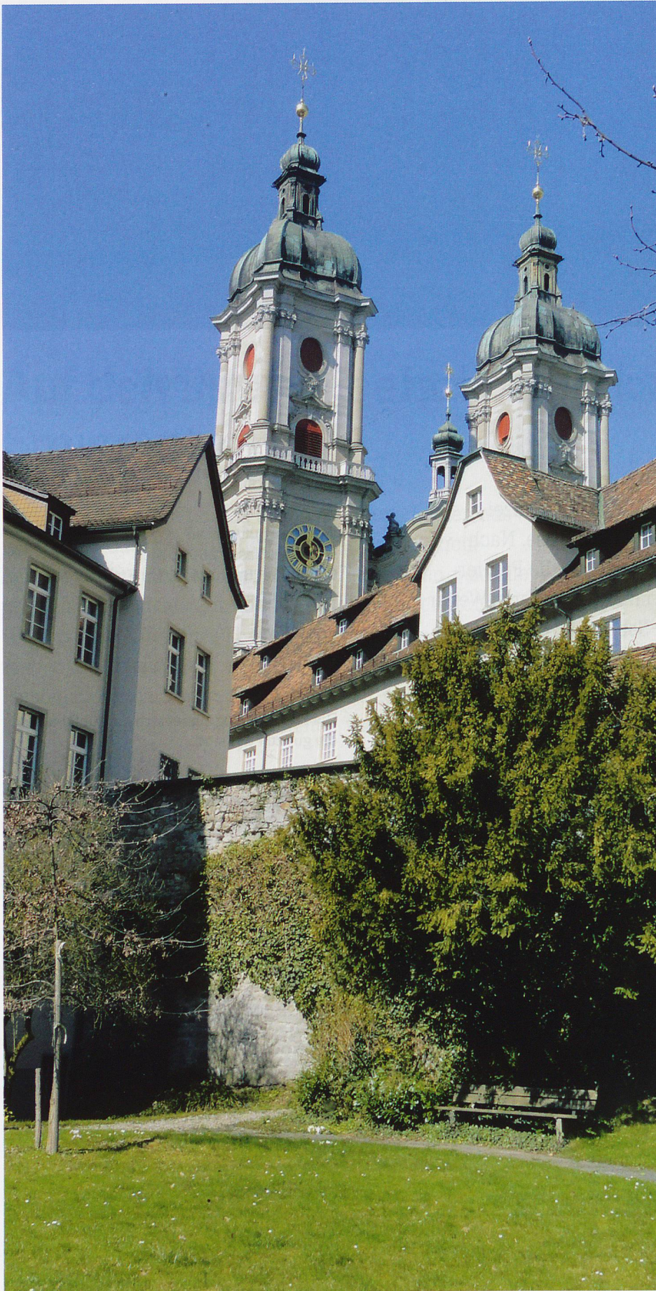
Ungewohnter Blick auf die Kathedrale von St. Gallen. Unweit von hier befindet sich die Station Mühleggbahn.