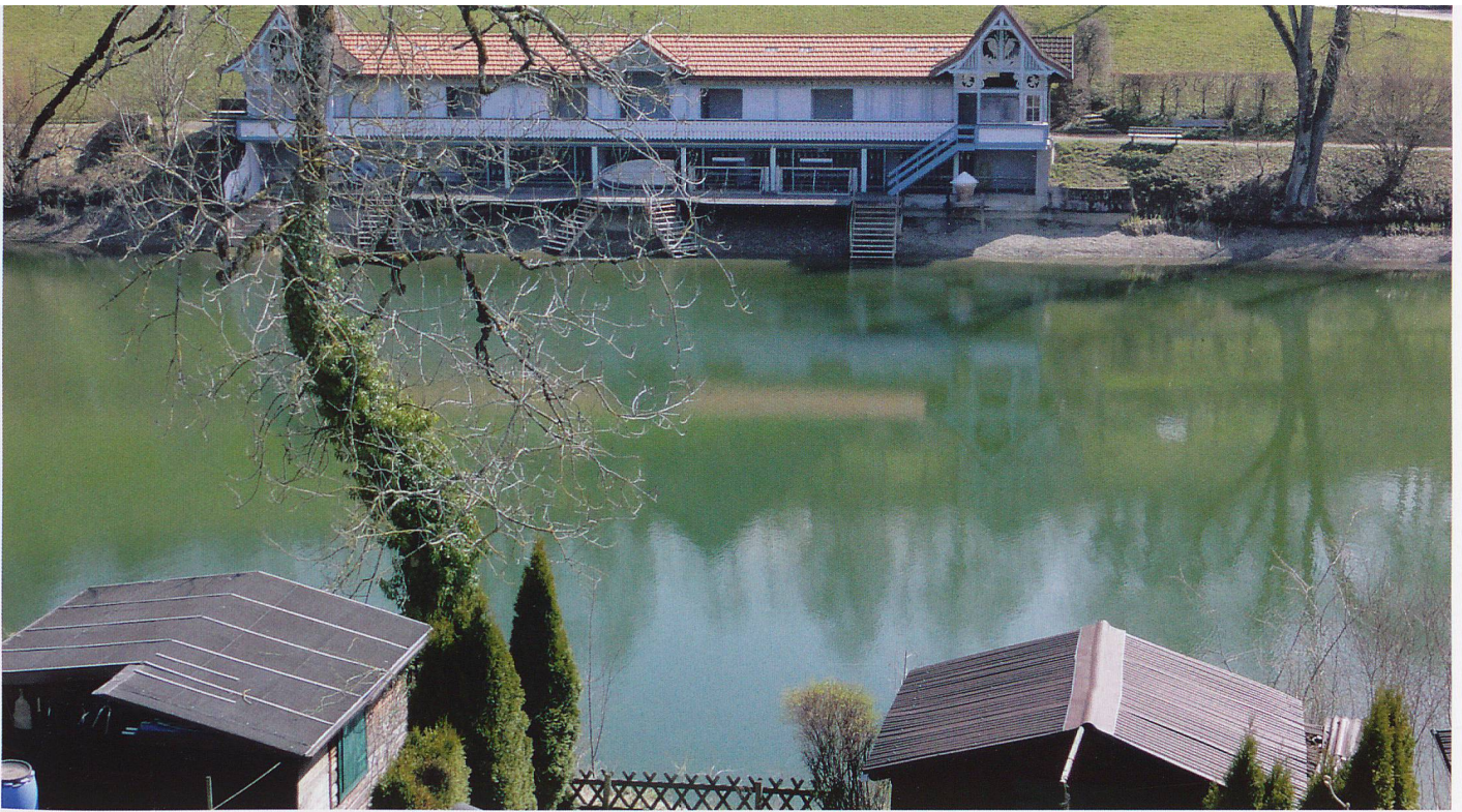
Das Gebiet der «Drei Weieren» oberhalb der Gallusstadt auf dem Freudenberg ist das Naherholungsgebiet schlechthin. An warmen Tagen lässt sich hier baden und geniessen.