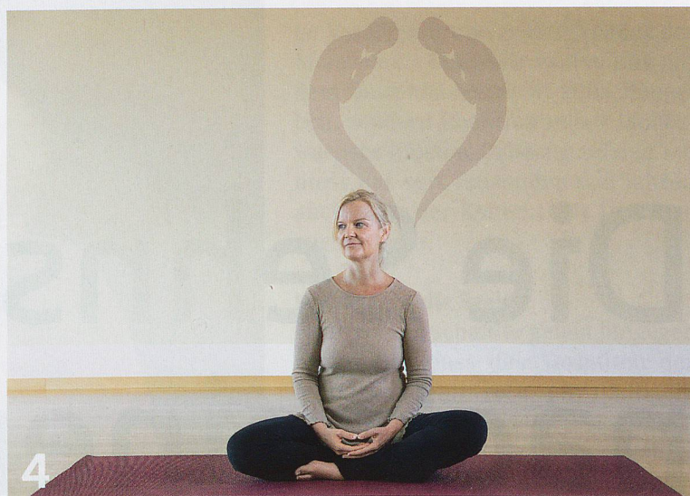
4 Mit der Vorstellung eines Jenseits verbindet sich die Suche nach dem Sinn des Lebens. Menschen mit Nahtoderfahrungen berichten.