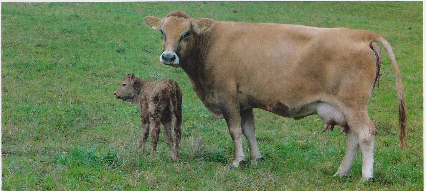
Beim Aufstieg zum Punkt, wo die Grenze zu Deutschland verläuft, hält ein Hof seine Tiere – in Mutterkuhhaltung.