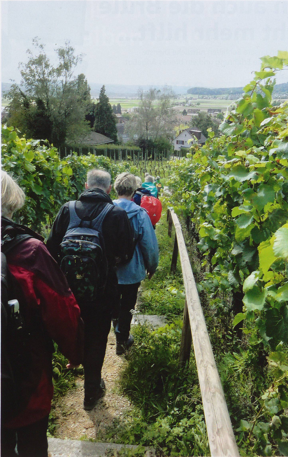
Rebberge bei Rafz, geschmückte Häuser und Brunnen in Wasterkingen, Würste über dem Feuer im Wald; und in einem Stall wird gerade ein Pferd beschlagen.