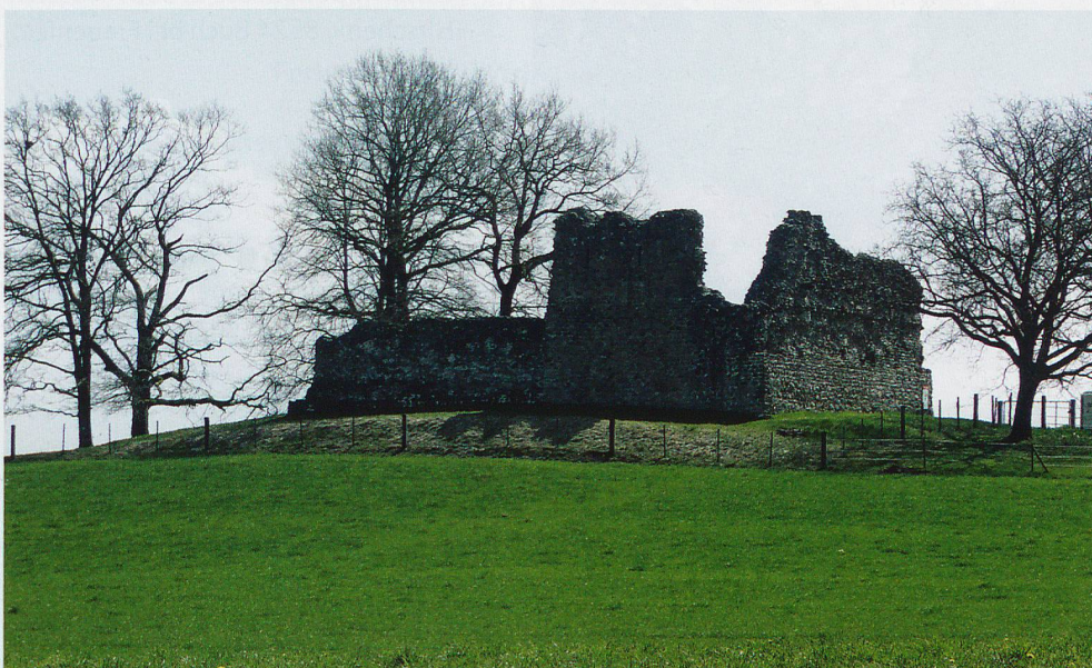
Die Burgruine Helfenberg ist von weit her sichtbar.