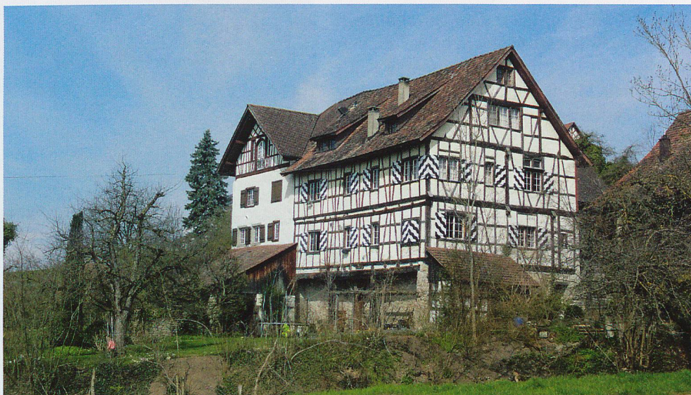
Das Gut Klösterli/St. Bläsi fällt auf durch seine typische Fachwerkbauweise.