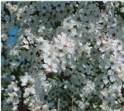
Die Sträucher um die Seen blühen prächtig.

In beiden Seeteilen bieten schilfbestandene Buchten, zum Teil ausge dehnte Teichrosenfelder sowie Nixenkraut und andere Unterwasserpflanzen Lebensraum für einige Fischarten. Als wichtigste vorkommende Fischarten gelten Hecht, Zander, Egli, Aal, Karpfen, Schleie, Brachsamen, Rotaugen, Rotfeder (Röteli) und Laube (Läugel).