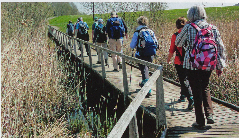
Immer wieder führen Holzstege über die moorigen Landstriche rund um den Hüttwilersee.