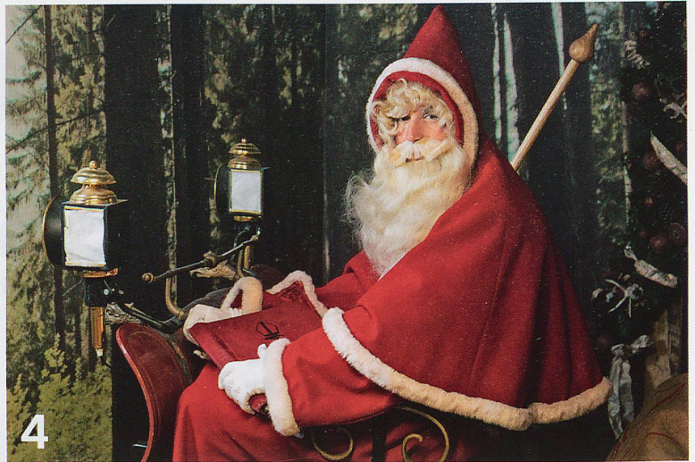
4 Wertewandel und Traditionen: Werte gehen nicht einfach verloren. Aber sie wandeln sich bis ins hohe Alter und werden vielfältiger.