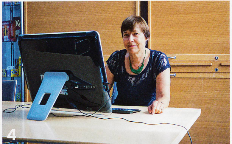
4 Ältere Menschen tun sich mit den Möglichkeiten, die die Digitalisierung bietet, teilweise noch schwer. Immer mehr aber entdecken auch die Vorzüge. Visit beleuchtet die Vor- und Nachteile und nennt die Fallstricke.