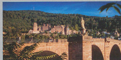
Neckar Flussfahrt 22. - 30. August 2020 / 9 Tage

Bangkok - Ayutthaya - Sukothai - Chiang Mai - Chiang Rai - Chiang Khong - Pakbeng - Luang Prabang - Bangkok Preis pro Person ab CHF 5790.-