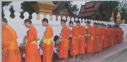
Thailand Laos Rundreise 15. - 29. Februar 2020 / 15 Tage

Buenos Aires - 15-tägige Kreuzfahrt - Montevideo - Puerto Madryn - Pt. Stanley - Kap Hoorn - Ushuaia - Punta Arenas - Puerto Montt - Santiago de Chile Preis pro Person ab CHF 6890.-