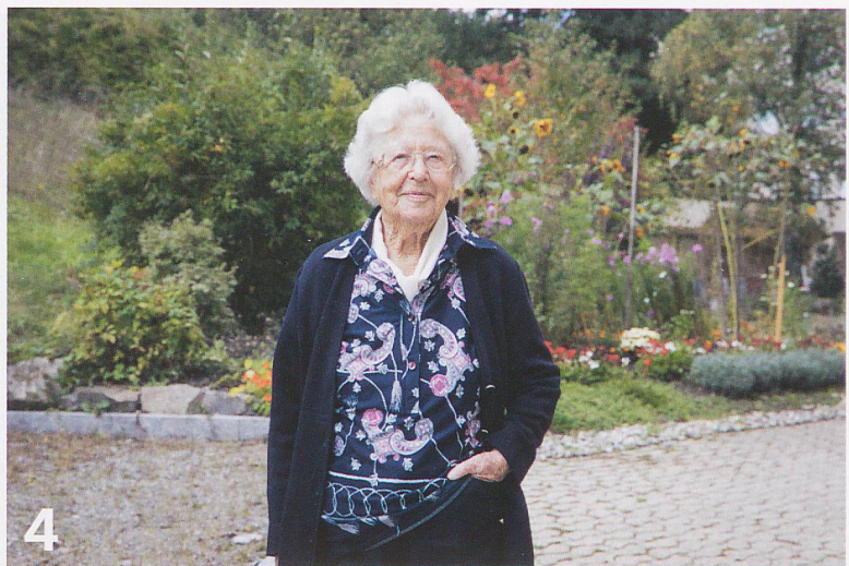
Die Frage nach dem Sinn des Lebens stellt sich angesichts des nahen Endes gerade älteren Menschen in vermehrtem Masse.