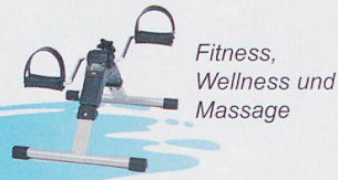
Fitness, Wellness und Massage