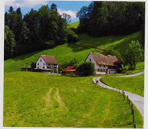
Die Wanderung führt durch eine wunderbare Landschaft und entlang der Sihl, unter anderem durch abenteuerliche Tunnelwege (Bild unten).