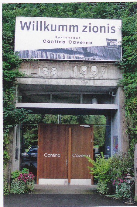
Eingang zur fantastischen Welt des «Brünig Park» und der Cantina Caverna.

als Bruder Klaus bekannten Niklaus von Flüe (mit etwas mehr als einer Stunde Wanderzeit). Erstens. Und zweitens würde von hier aus eine rund siebenstündige Wanderung hinauf zur Älggialp führen und damit zum geografischen Mittelpunkt der Schweiz.