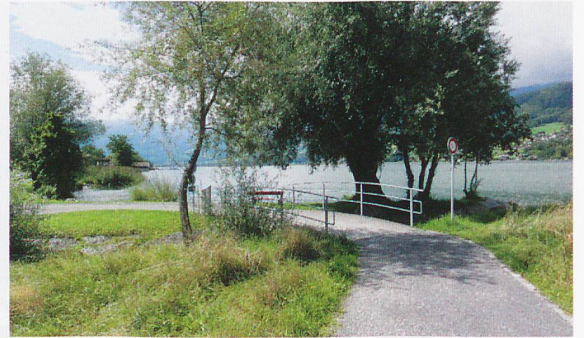
Die Wanderung dem Ufer des Sarnersees entlang bietet Ruhe, schöne Blickwinkel und derzeit eine grosse Baustelle.