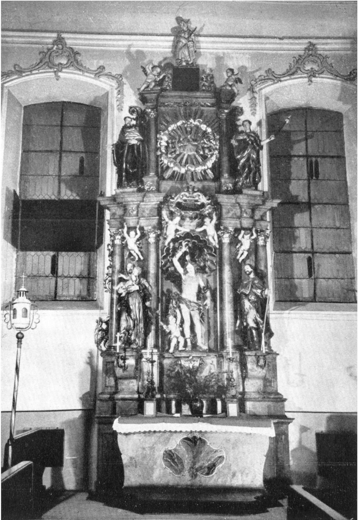
Sebastiansaltar in der Kirche zu St. Martin in Rheinfeldern. (S. Wyss, Festschr., S. 5 ff. u. S. 22 ff.)