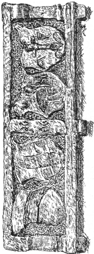
Wappentafel in Hornussen.