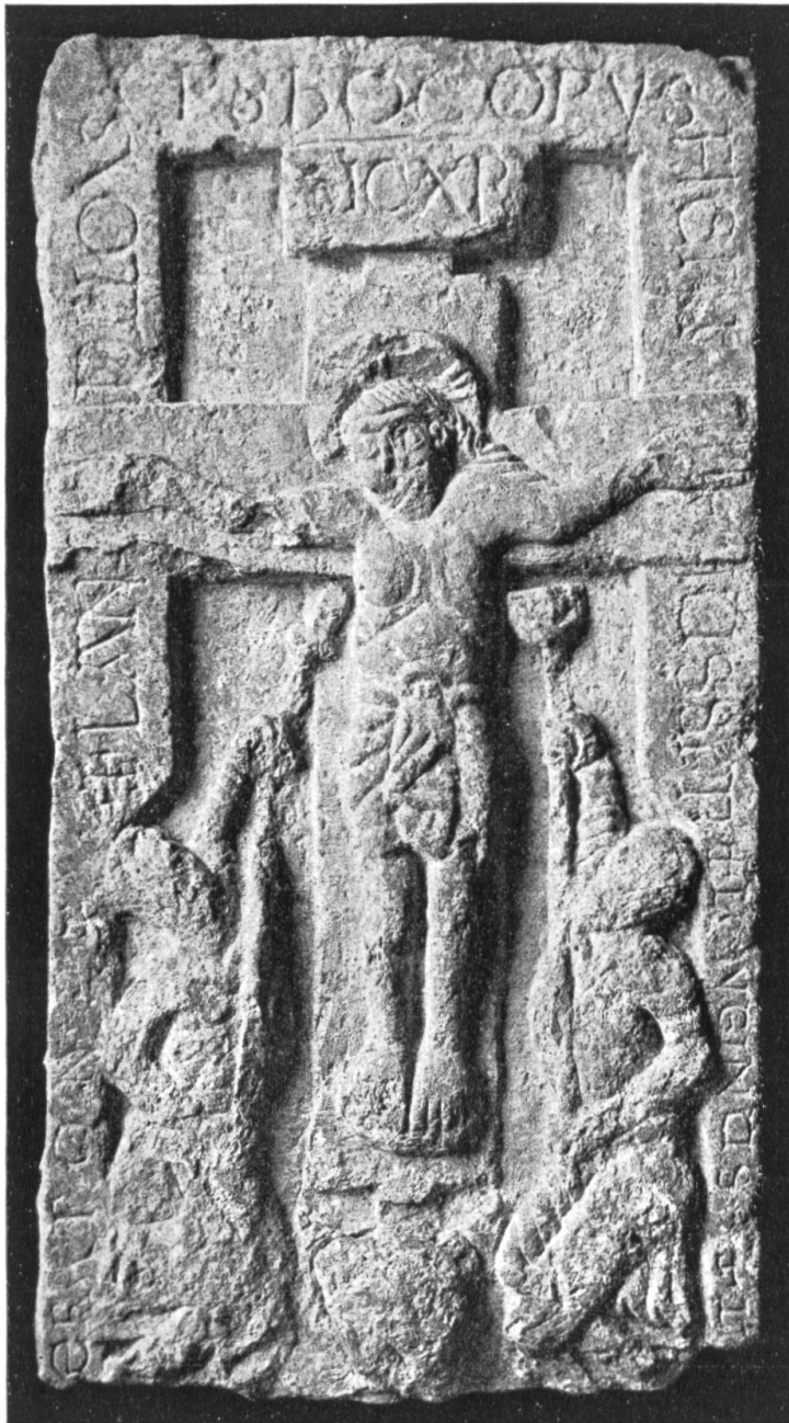
Christusrelief aus der Verenakapelle in Herznach. Heute im Antiquarium in Aarau.