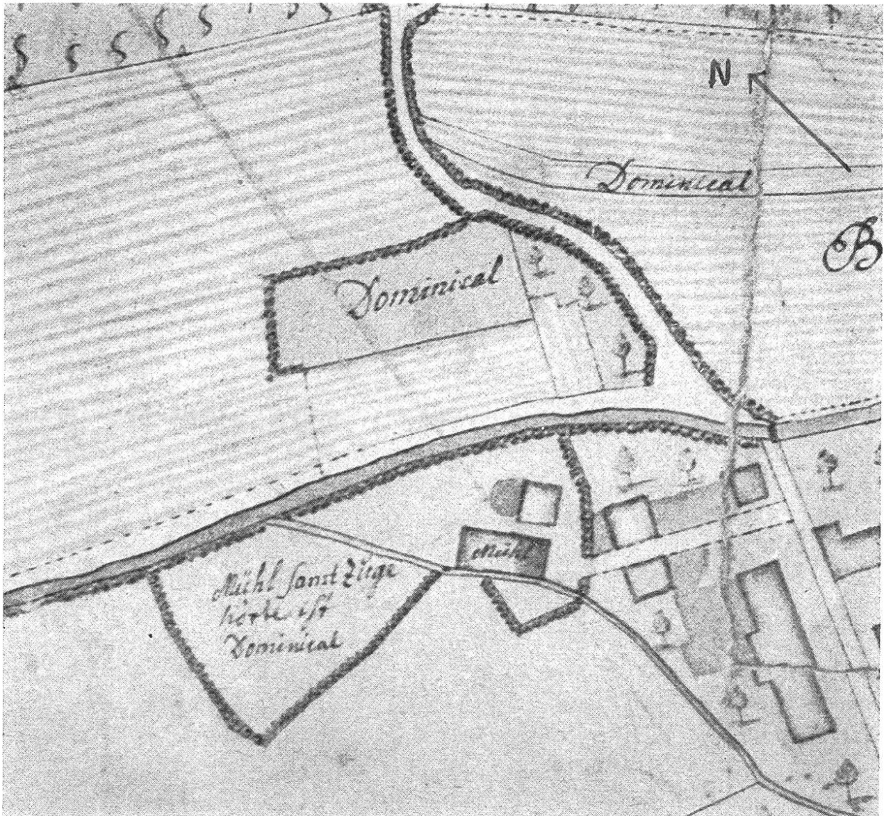
Die Mühle zu Hornussen (Detail aus Plan Garnie)

Wenn wir uns fragen, ob die Hornusser Fronmühle immer dort betrieben wurde, wo heute die Säge steht, so ist diese Frage mit grösster Wahrscheinlichkeit zu bejahen. Ganz sicher stand sie seit 1555 an jener Stelle, denn der beim Brande von 1901 zerstörte Türsturz trug die Jahreszahl 1555. Damals mag die Mühle in Stein erbaut worden sein. Vorher dürfte sie ein Holzbau gewesen sein.