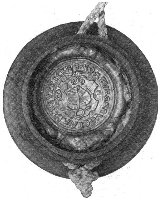
Homburger Vogtamtssiegel 1764