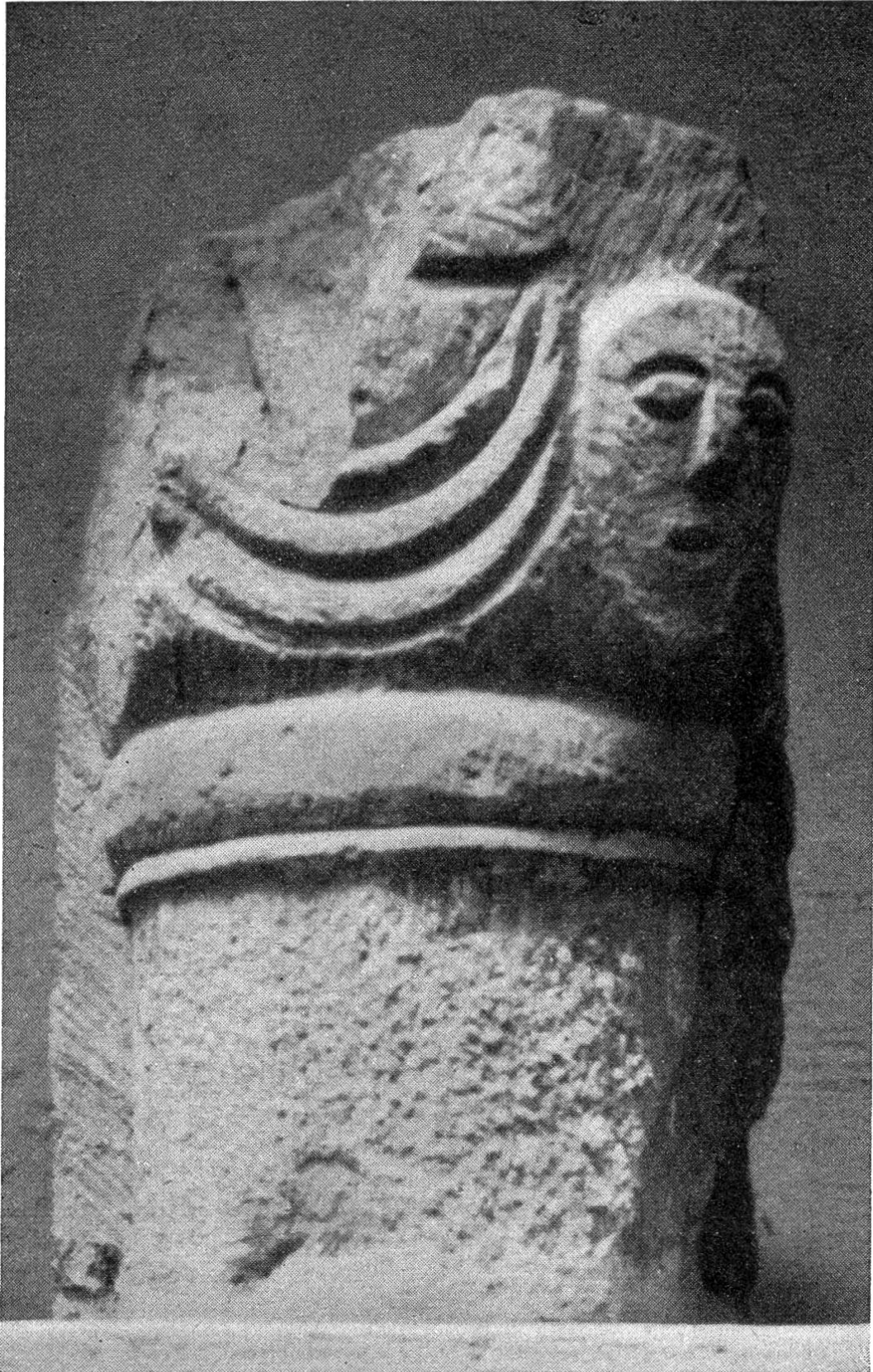
Drei Kapitelle aus der St. Martinskirche in Rheinfelden, heute im Fricktalischen Heimatmuseum. Das Blattkapitell ist 20 cm hoch, das Kapitell mit der Maske total 29 cm; das frühgotische Stück misst samt Gewände 26 cm in der Höhe und 39 cm