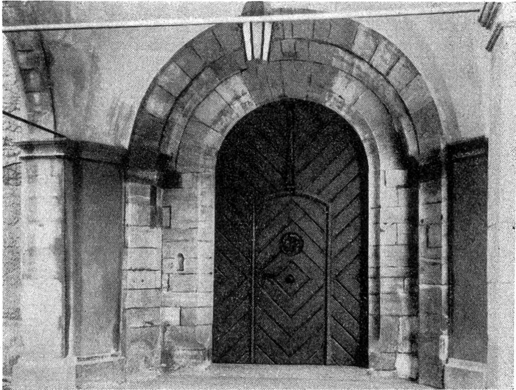
Romanisches Westportal der St. Martinskirche in Rheinfelden.