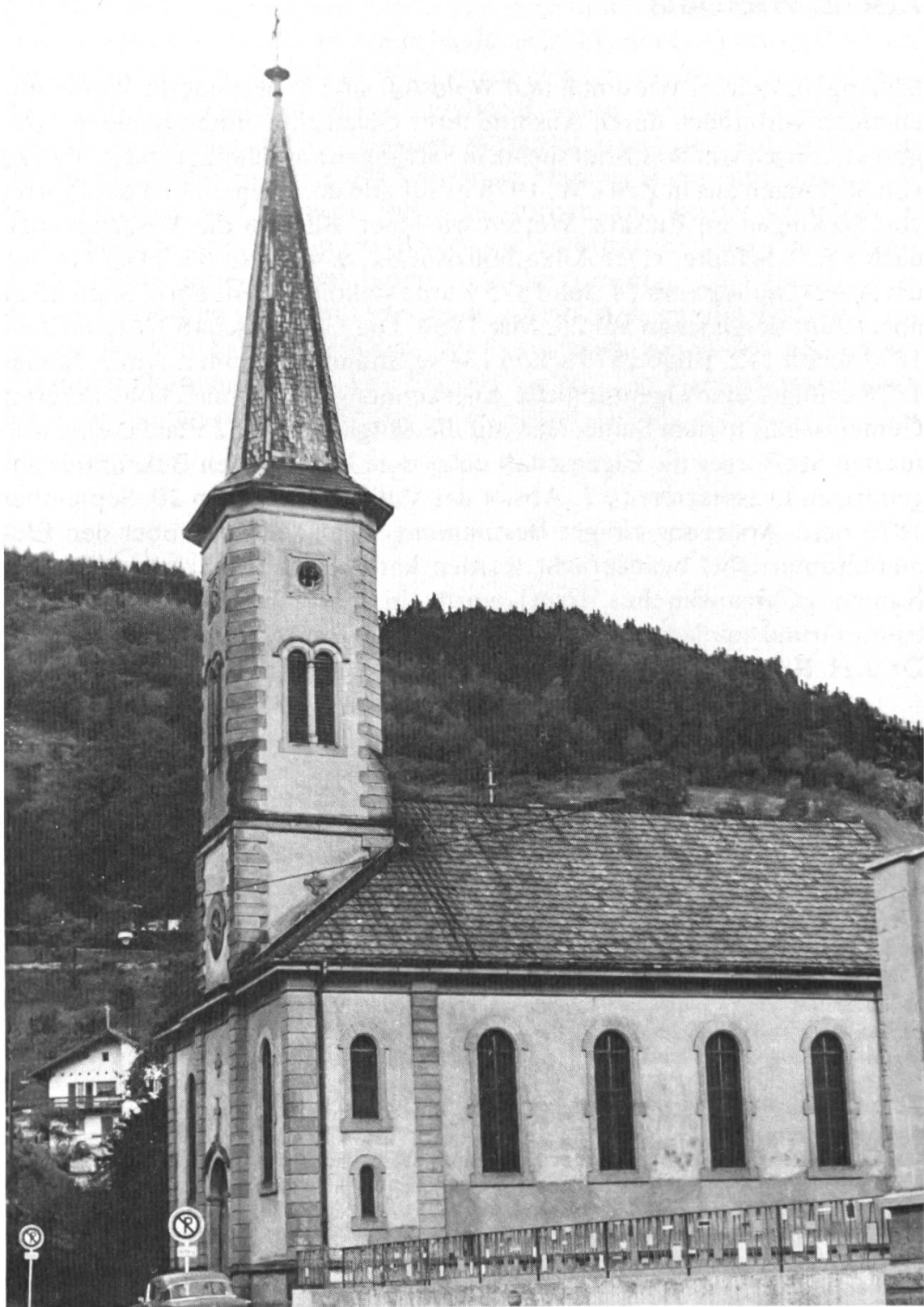
Altkatholische Christuskirche in Zell i.W.