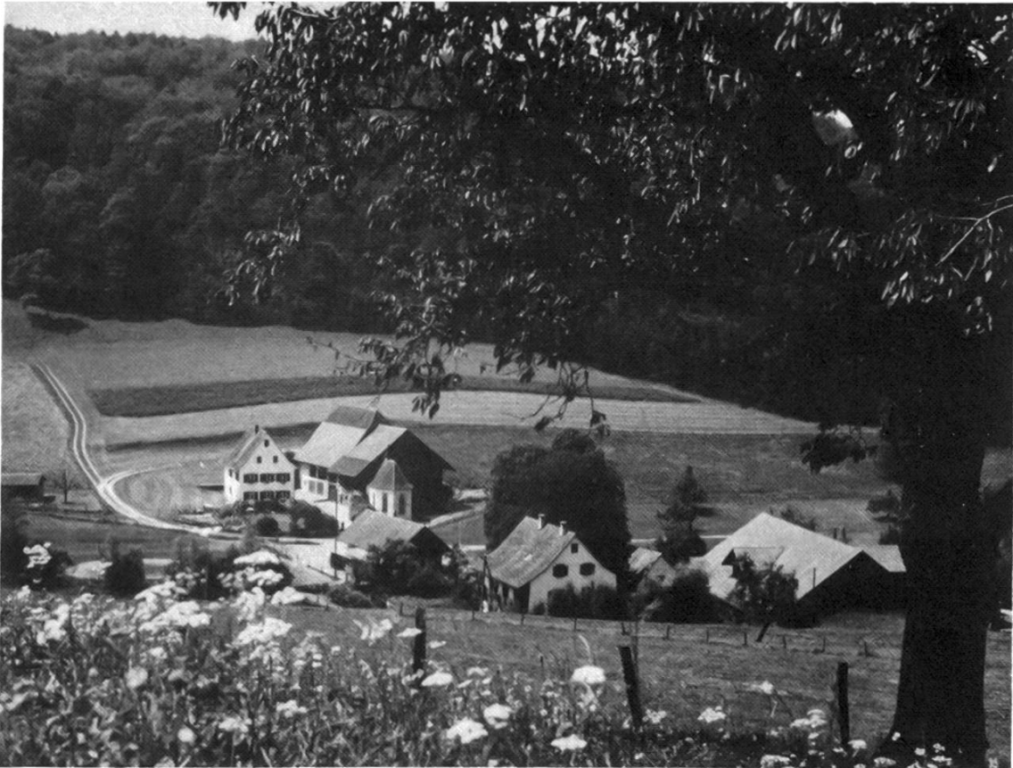
Iglingen: Chor der ehemaligen Kapelle mit neuer angebauter Scheune, links davon das ehemalige Schwesternhaus.