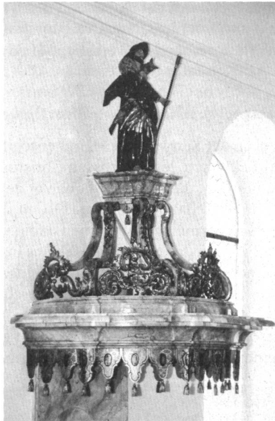
Der fein gearbeitete Schaldeckel über der Kanzel mit dem guten Hirten.

wesen sein darüber, wenn sie das beschwerliche Treppensteigen nicht vor aller Augen vornehmen mussten. Nach langem Werweissen wurde dieser Zugang auch jetzt belassen. Finanzielle Mehrkosten und Raumknappheit gaben hier den Ausschlag.