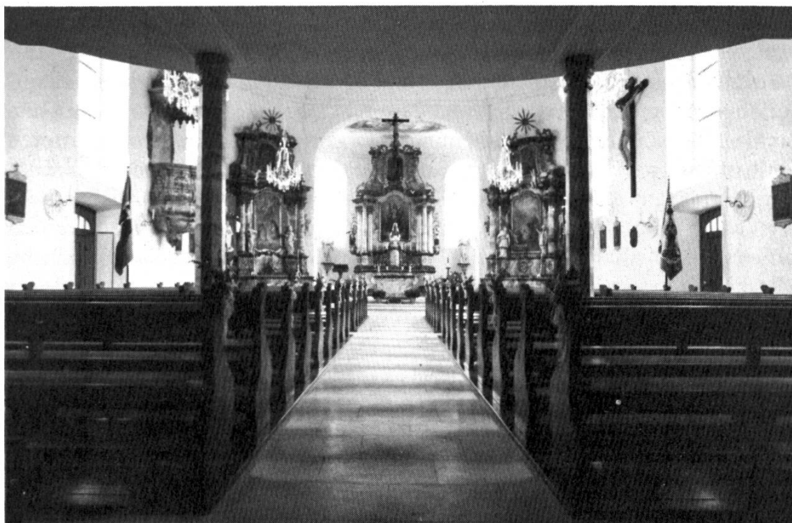
Inneres der Kirche Wegenstetten.

Wer die Kirche zum ersten Mal nach der Renovation 1984 bis 1986 betritt, wird überrascht sein über die Aufwertung, die sie in den letzten Jahren erfahren hat. Ihre früher eher spärliche Ausstattung wurde da und dort ergänzt, Unschönes oder Artfremdes entfernt oder wo möglich so angeglichen, dass der Gesamteindruck nicht mehr gestört werden soll. Bei allem aber merkt man, dass man den Kirchenraum so gestalten wollte, wie das der Wunsch der Erbauer hätte sein können, wenn ihnen die Mittel gereicht hätten. Hier ha-