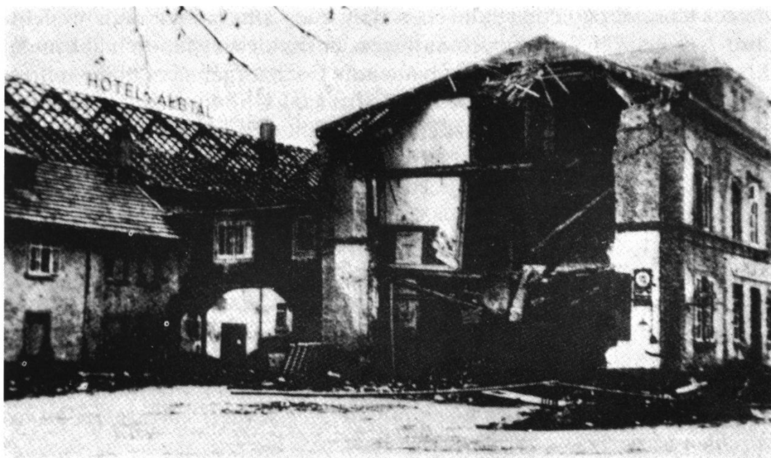
Das von Bomben getroffene Hotel Albtal in Albstadt (27 Todesopfer)

Die Stimmung in der deutschen Bevölkerung interessierte ebenso, und die verbliebenen Grenzgänger konnten darüber vorsichtige Aussagen machen. Ende März berichtete ein deutscher Pendler in einem Gasthaus in Stein über die Verhältnisse im Reich: Die Lebensmittelrationen seien recht knapp geworden, die deutsche Bevölkerung sei müde und hoffe auf ein baldiges Kriegsende. 8 Die Alliierten, vorab Teile einer französischen Armee, wurden bei Basel gemeldet. Die Atmosphäre in den Rheinortschaften wurde merklich gespannter.