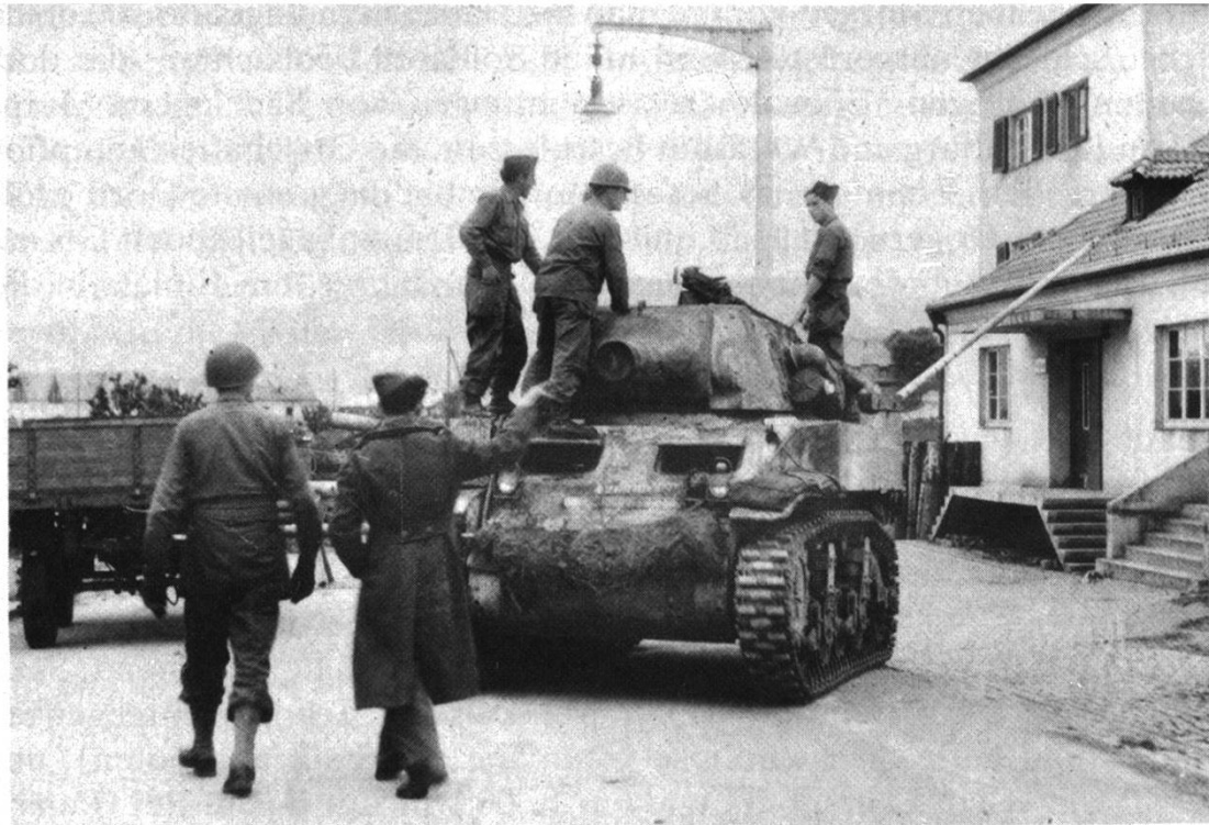
Französische Panzer in Waldshut

Die Rheinkraftwerke an ihrer exponierten Lage gaben zu grossen Sorgen Anlass. Wöchentlich näherten sich die Kriegsfronten Deutschland, und man musste befürchten, dass der Hochrhein in absehbarer Zeit in den Mittelpunkt heftiger kriegerischer Auseinandersetzungen geraten könnte. Im November 1944 fand in Basel eine Besprechung der Verantwortlichen statt, die Schutzmassnahmen für die Rheinkraftwerke im Falle von Bombardierungen erörterten. Eine Kommission wurde gebildet, die die erforderlichen Massnahmen zu erarbeiten hatte. Das Resultat waren ein Verbindungssystem für den sogenannten Werk- und Wasseralarm und Vorschriften für die im Alarmfall zu treffenden Massnahmen. Hinzu kamen später Anordnungen zur Verhütung einer willkürlichen Öffnung der Stauwehre durch die Deutschen, die damit eine künstliche Hochwasserwelle im Falle alliierter Rheinübersetzungsaktionen hätten erzeugen können. 17