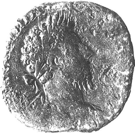
Vorderseite: Marc Aurel (161–180)