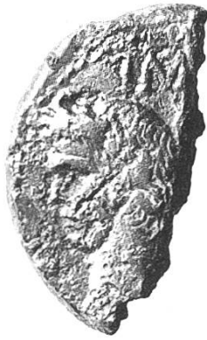
Vorderseite: Augustus (31 v. Chr. – 14 n. Chr.)