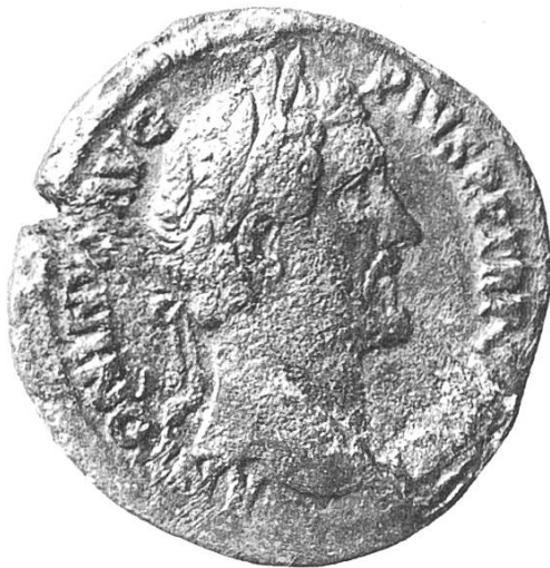
Vorderseite: Antoninus Pius (138–161)