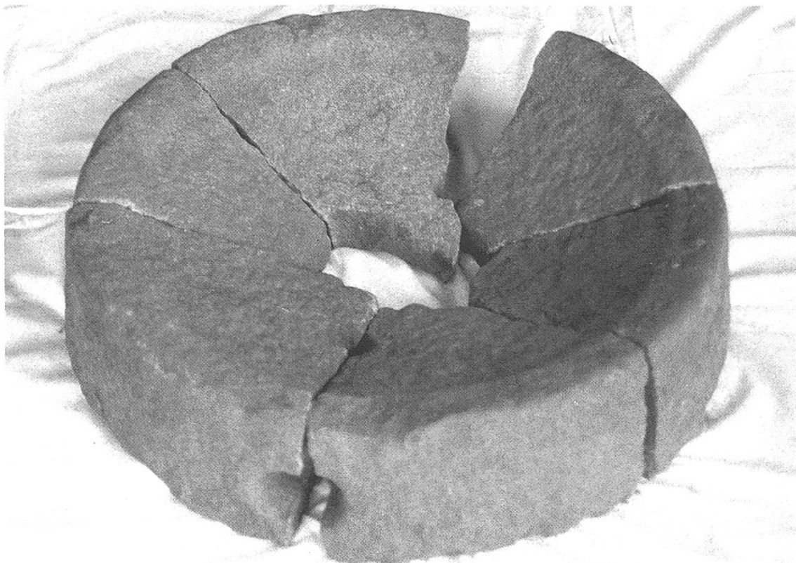
Abb. 5: Der obere Mahlstein der Handmühle, welcher einen Durchmesser von 42 cm besitzt. Das runde Loch in der Mitte diente zum Einführen eines Holzstabes, mit dem der obere Stein auf dem unteren gedreht wurde.