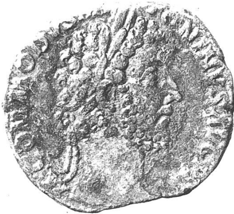
Vorderseite: Commodus (180–192)