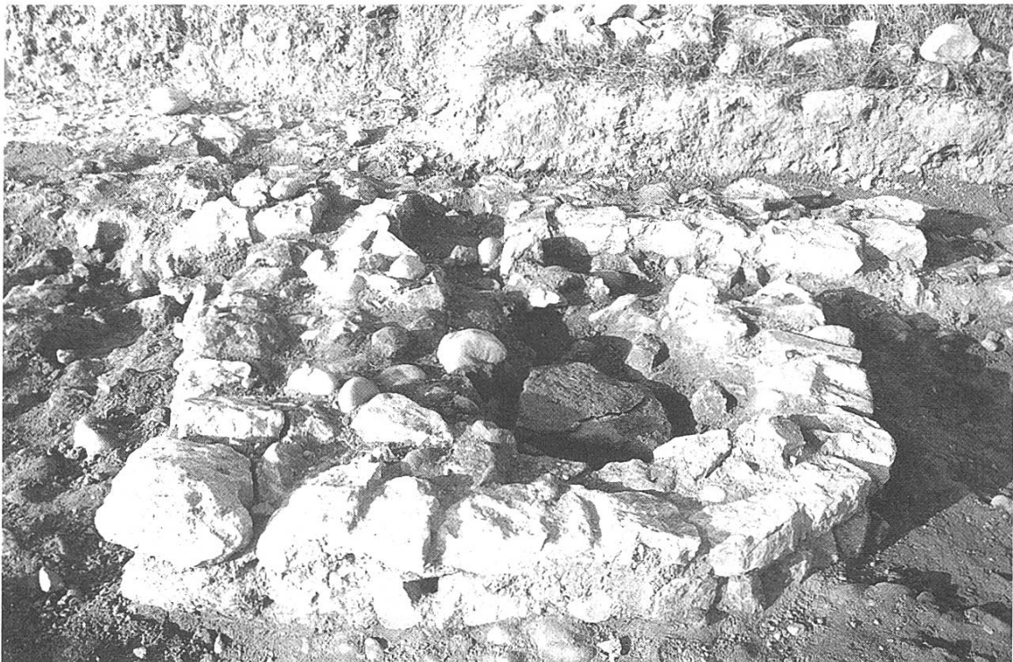
Abb. 3: Ein an die Innenseite der Nordmauer angelehnter halbrunder Bau, dessen Funktion noch nicht bestimmt werden konnte. Seine genaue Lage ist auf Abb. 2 schon ersichtlich.