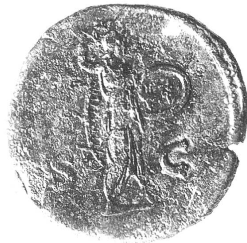
Rückseite: Minerva (Göttin des Verstandes) mit erhobener Lanze und Schild