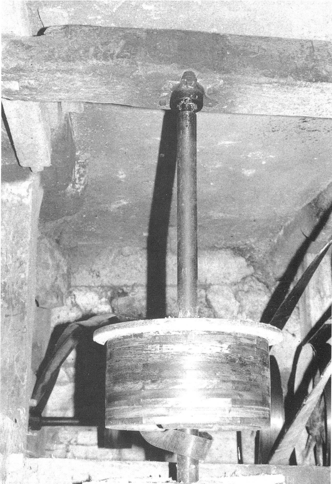
Kraftübertragung auf den Röndelstein in der Gansinger Mühle: Senkrechte Welle mit hölzernem Treibrad.