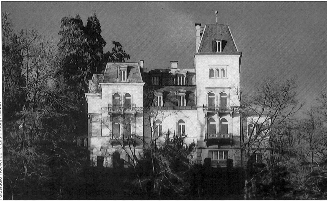
Abb. 3 Das «Schlössle» in Kleinlaufenburg in der Abendsonne.