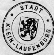
Abb. 4 Mrs. Codmans Ehrenbürger- urkunde wird heute im Stadtarchiv von Kleinlaufenburg aufbewahrt.