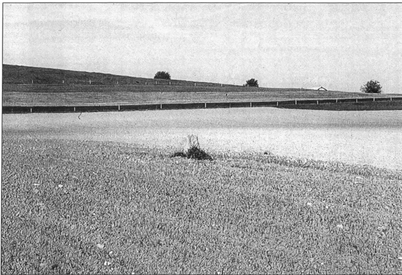
Abb. 1 Einsam steht heute der Marchstein auf Ärfenmatt, der einen herrenlosen Platz bezeichnete, wo im Dreieck Wegenstetten-Hellikon-Hemmiken mehrere Herrschaftsgrenzen zusammenstiessen.

An Stellen, wo mehrere Herrschaftsgrenzen zusammentrafen, gab es manchmal ebenfalls herrenlose Plätze, wo Rechtsstillstand herrschte. Dies lag wohl in der Heiligkeit der Grenzlinien begründet, die schon aus römischer Zeit überliefert ist. Als eine solche Stätte galt die sagemumwobene Ärfenmatt oberhalb Wegenstetten, wo heute die Gemeindegrenzen von Wegenstetten, Hellikon und Hemmiken aufeinandertreffen. Dort lösten einst drei Adlige einen Grenzstreit und setzten einen Stein. Dieser bezeichnet auf der Spitze des Berges den Platz, welcher herrenloser Boden ist, weil da drei Grenzen in einem Dreieck zusammenstossen. Er gilt für eine Freiung und wird von den Heimatlosen oft aufgesucht, weil den Landjägern da keine Macht über sie gegeben ist 11 .