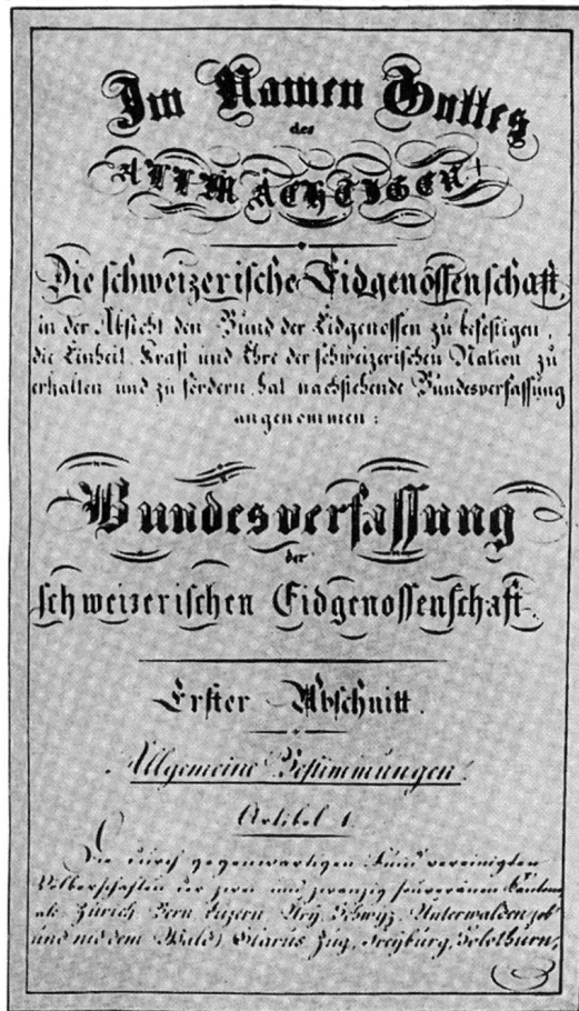
Abb. 7 Bundesverfassung von 1848. Erste Seite des Originals der neuen Verfassung.

verschwiegen. Doch darf man nicht übersehen, dass auch in Frankreich «Schweizer», das heisst Genfer wie Rousseau und Necker oder der Waadtländer Benjamin Constant und Pestalozzi, grossen Einfluss auf die Geschehnisse ausgeübt haben. Jakob Burckhardt meinte, der Contrat social Rousseaus mit der Idee der Volkssouveränität sei vielleicht das grössere Ereignis als der Siebenjährige Krieg 25 . Mit der Übernahme des amerikanischen Zweikammersystems nahm man Rücksicht auf die kleinen Kantone, die im Ständerat ungeachtet ihrer Grösse über die gleiche Stimmkraft verfügen