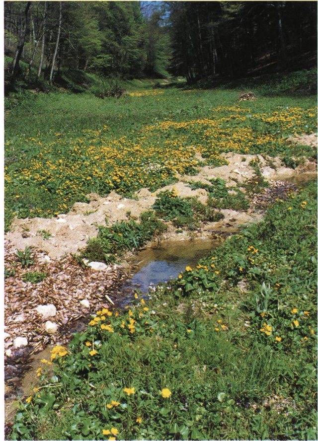
Abb. 10: Ramlinsburg CH: Dotterblumenwiese in einem Talgrund des Tafeljuras.

das unter den Bäumen schimmert (Abb. 7). Das Schaumkraut bevorzugt diese frühlingsfeuchten Böden im Trauf der Bäume und breitet sich umso stärker ins Offene aus, je mehr sich die Wiesen dem Hangfuss, den Bachauen nähern. Solche Standorte würden auch der Tag-Lichtnelke behagen, der so genannten Fleischblume (Mühlberg 1880), die etwas später aufgeht. Vermochte sie vor 60 Jahren feuchte Wiesen und Wässermatten mit ihrem besonderen Rot noch zu färben (Zoller u. a. 1983), ist sie heute völlig aus dem hiesigen Kulturland verdrängt und nur in einem einzigen Fricktaler Landschaftsinventar erwähnt. Nicht viel häufiger (Tabelle 1) wurde die Kuckucksnelke gesehen, die nächste Art in der farbigen Gilde der Feuchtwiesenpflanzen. Die Stellen sind selten, wo die Pflanze solch dichte Herden bildet, dass sich ihre fröhlich gefransten Kronblätter in einer einzigen, rot-violetten Blütenwolke auflö-