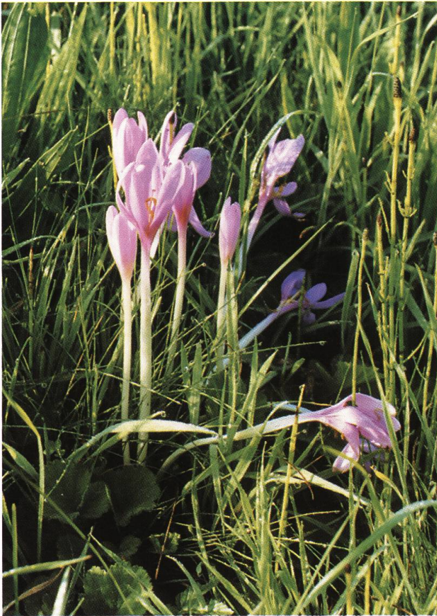
Abb. 9: Wegenstetten CH: Herbstzeitlose, Anfang September.