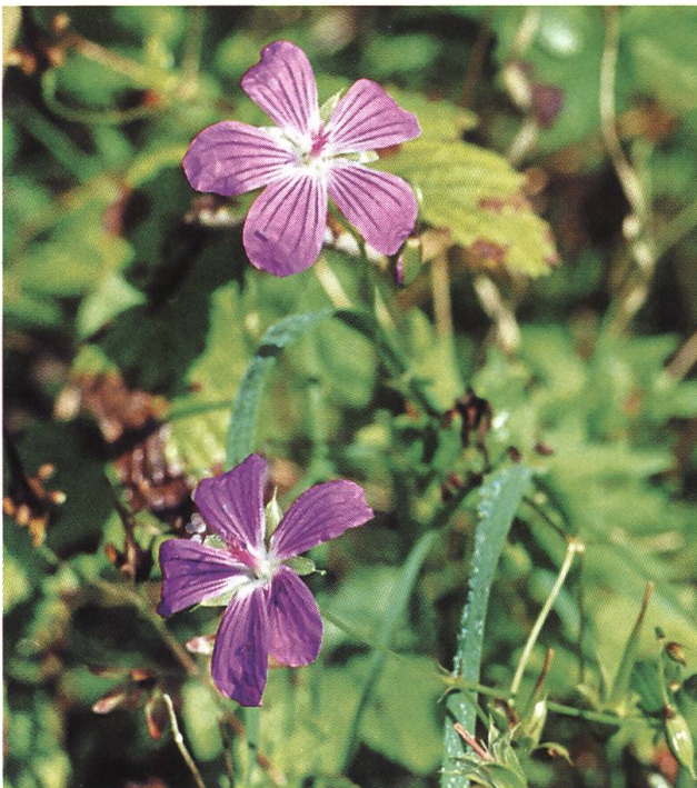
Abb. 8: Zeihen CH: Sumpf-Storchschnabel, Ende August.

die feuchten Fettwiesen in den Bachauen oder die feuchten Hangstellen; im Zuge der Güterregulierungen wurden solche Wiesen drainiert und umgebrochen, an abgelegenen Orten aufgegeben und aufgeforstet. Dort will sich aber kein richtiges Waldgefühl einstellen; zu merkwürdig mutet das hüfthohe, mastige Gekraut an zwischen den Reihen der Eschen, zu fremd die rote Tag-Lichtnelke neben den dunklen Fichten (Abb. 6). Dieser Pflanze und den auffälligen Farben Rot, Lila oder Violett gilt es zu folgen; sie sind Markierungen und Erkennungszeichen untergegangener wie auch noch existierender Feuchtwiesen.