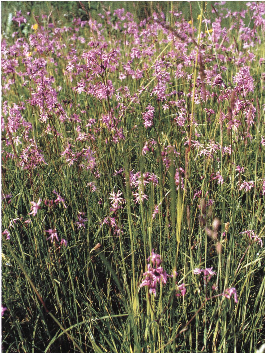
Tabelle 1: ↗ Ausgewählte Pflanzen und Lebens- räume im Fricktal gemäss den Landschaftsinventaren der Jahre 1984 bis 1993.