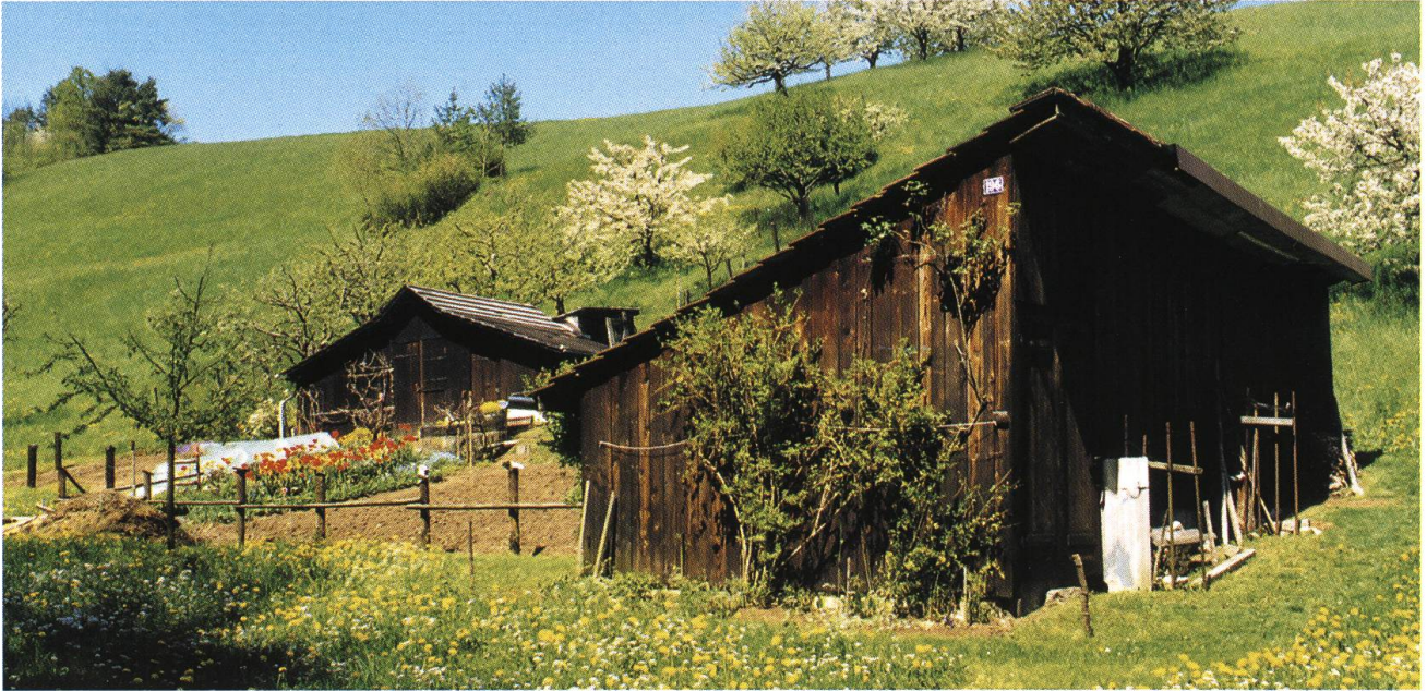
Abb. 12: Densbüren CH: Feldschopf und Pflanzblätz, vielfältige Nutzungen schaffen eine vielfältige Landschaft.

men sehen will, muss über die Grenzen; entweder ins obere Murgtal im Hotzenwald (Koeppler 1988), oder dorthin, wo Pfarrer Lutz vorbei kam, ins Tal bei Anwil, nicht sehr weit von der Wittnauer Grenze. Dass jene prächtigen Matten und auch andere Feuchtwiesen heute noch existieren, in Zeihen, Anwil, Wittnau oder Giersbach, verdanken sie dem Militär, das freie Schussfelder braucht, aber vor allem dem Naturschutz.