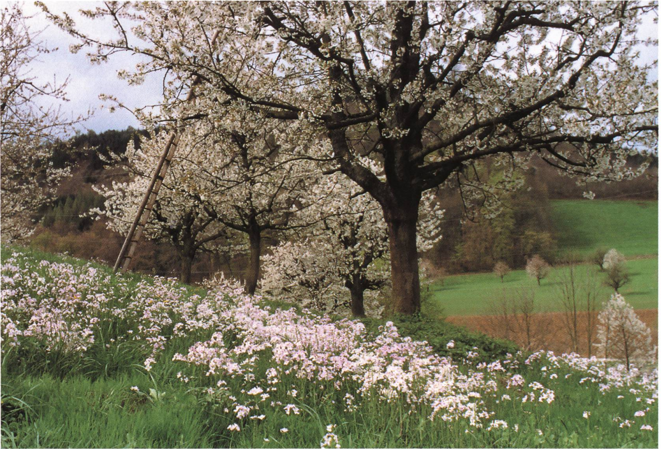
Abb. 7: Gipf-Oberfrick CH: Kirschbaum und Wiesenschaumkraut, Anzeiger leicht toniger, frühlingsfeuchter Böden.