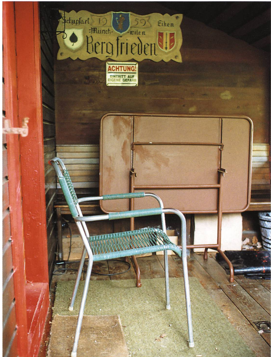
Abb. 5: Schupfart CH: «Schnyder-Alp», 480 Meter über Meer.

Rebhang, unter die Eichen des sonnigen Waldrands und vor allem, wenn immer möglich, zum Föhrenwäldchen.