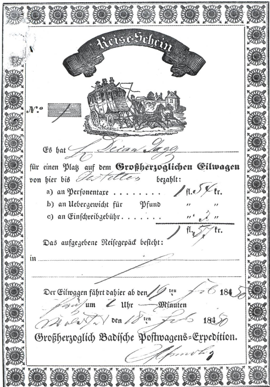
Abb. 4: Fahrkarte für eine Postkutschenfahrt von Waldshut nach Jestetten am 19. Februar 1850.

Oberrhein begonnen. Jahrelang war offen, ob die von Karlsruhe nach Süden führende Bahn Basel als Endpunkt haben sollte oder ob Basel als ausländische Stadt durch eine Tunneltrassierung von Haltingen über Lörrach–Hagenbacher Hof–Degerfelden–badisches Hochrheintal ostwärts umfahren werden sollte. Ergänzend war nur eine Stichbahn Lörrach–Basel in den ersten Verhandlungen. Hilfe bekamen die badischen Eisenbahnbauer sogar von Zürich, wo Handelskreise der grossherzoglichen Regierung anboten, von Waldshut nach Basel rechtsrheinisch eine Nordbahn zu bauen, um die topografischen (Bözberg) und politischen