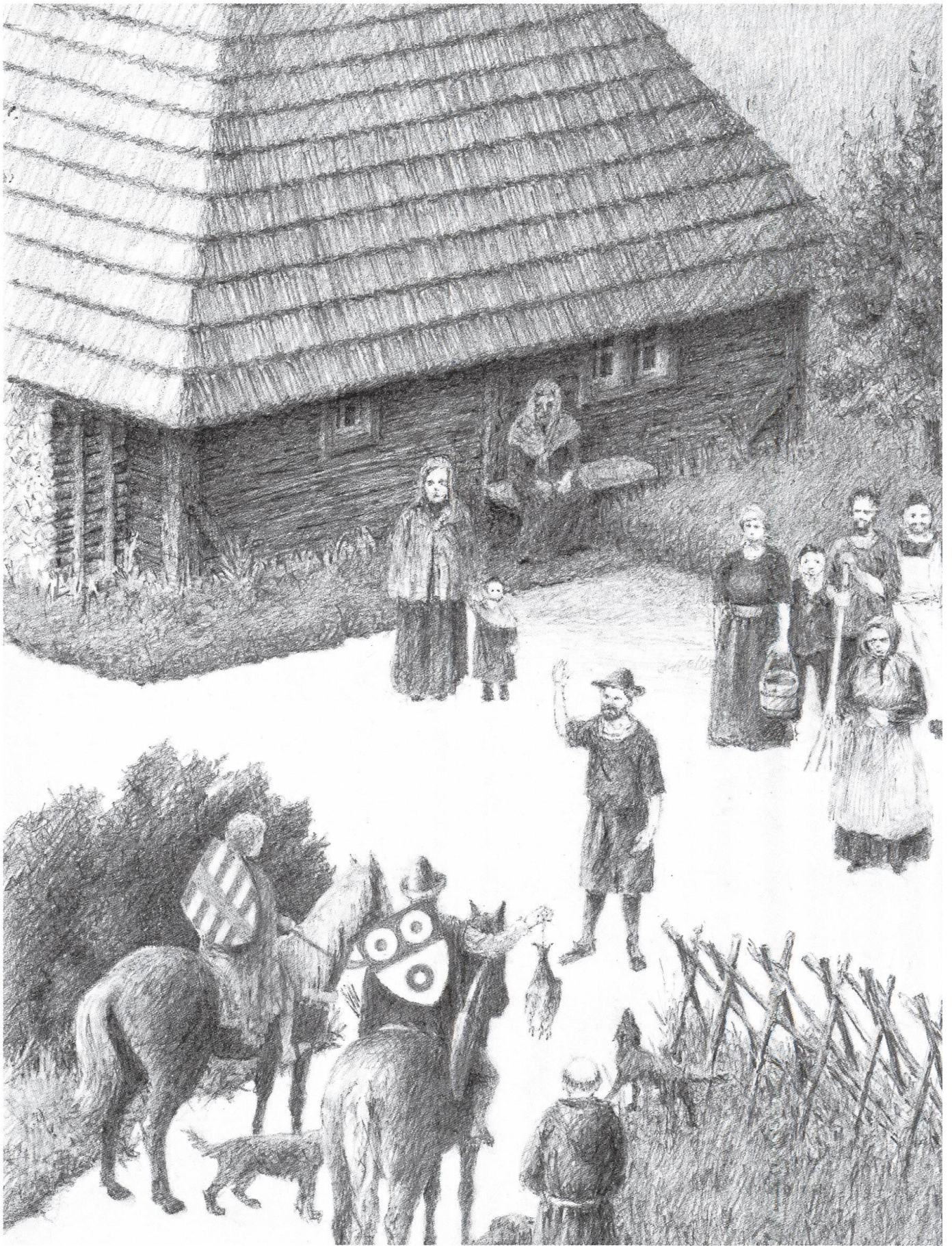
Abb. 7: Darstellung der Gerichtstage, das Dinggericht. (Bild: gezeichnet von Joseph Schelbert, Olten CH)