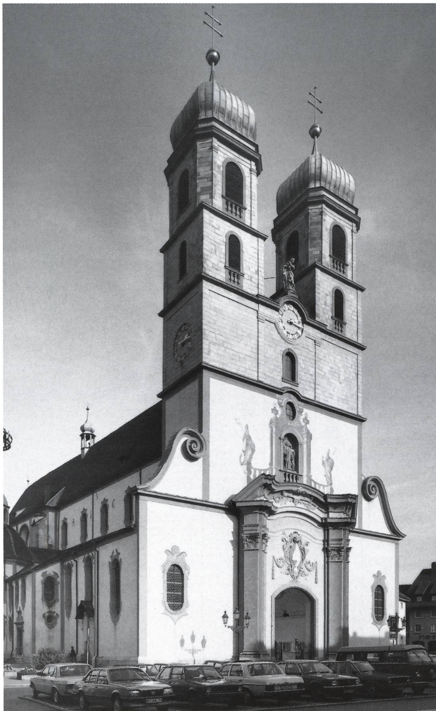
Abb. 4: Das St. Fridolinsmünster zu Säckingen. Für den Bau der Türme des Münsters in den Jahren 1724–26 leisteten die säckingischen Untertanen aus dem Fricktal über tausend Fuhren im Frondienst.

lich. Neben den Bodenzinsen bezog das Stift als Grundherrin ausserdem den Ehrschatz. Dies war eine Art Handänderungsgebühr und erinnerte noch an die alten Eigentumsverhältnisse. Sie musste entrichtet werden, wenn Güter durch Kauf oder Erbschaft die Hand wechselten.