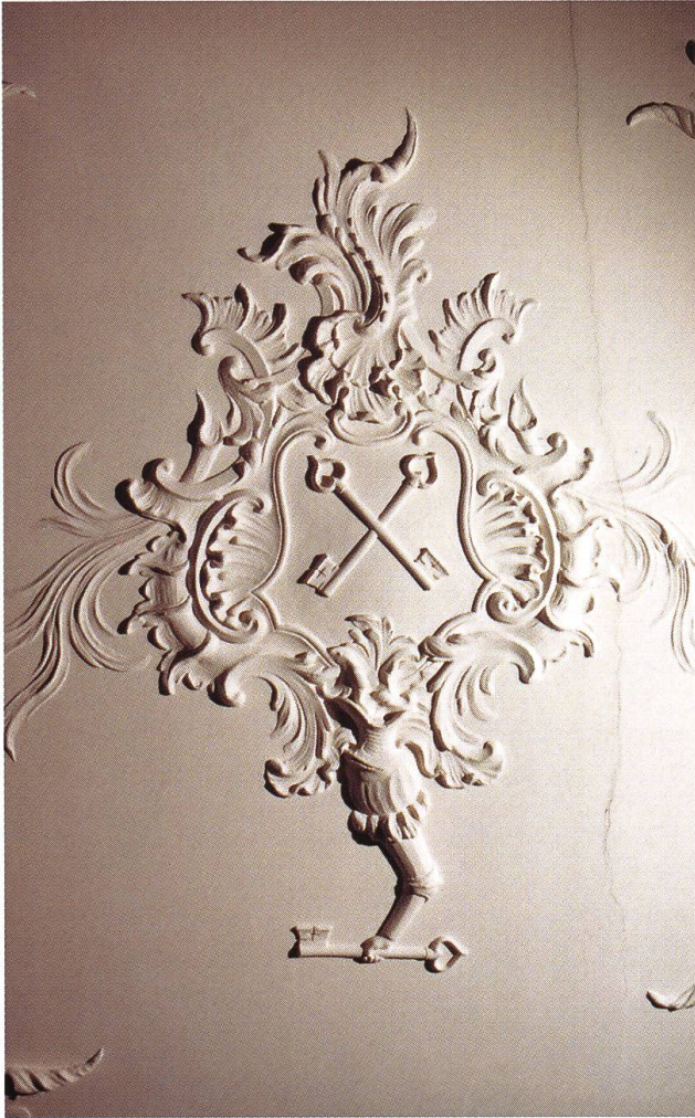
Abb. 9: Stuckatur im Gasthof Schwert in Hornussen. Der Deckenschmuck zeigt das Wappen der Familie Keller. Sie stellte seit 1671 während fast 90 Jahren die Stiftskeller des Dinghofes Hornussen.