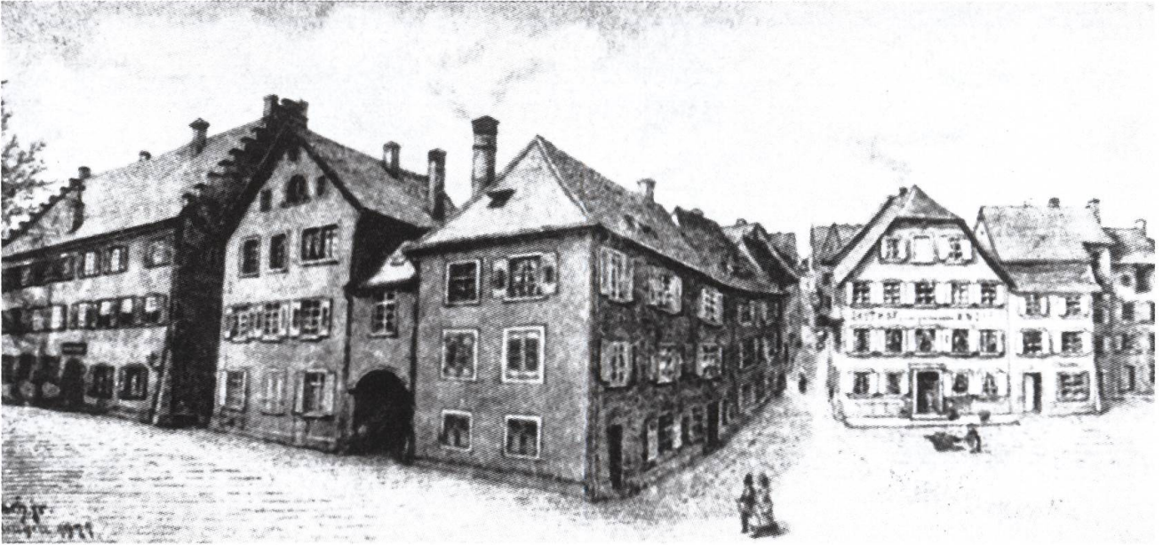
Abb. 3: Das Stiftsgebäude in Säckingen. Im grossen Gebäude links mit den Treppengiebeln residierte die Äbtissin. In ihrer Kammer urteilte sie in letzter Instanz über Streitigkeiten in den stiftischen Dinghöfen.

rei zu und es bezog den Grossteil der Zehnten. 5 Die niedere Gerichtsbarkeit betraf in erster Linie zivilrechtliche Angelegenheiten wie Kauf, Verkauf, Erbteilungen, Vormundschaften, Schuldverschreibungen und Ähnliches. Im Bereich des Strafrechts fielen unter ihre Kompetenz kleinere Vergehen bis zu einer Busse von ursprünglich 3 Schilling, später von 9 Schilling. Verhandelt wurden diese Materien vom Dinggericht unter dem Vorsitz des Kellers. Jegliche Handänderungen von Grundbesitz musste zudem vom Stift ausdrücklich bewilligt und gegen die Entrichtung einer Gebühr bestätigt werden. 6 Als Grundherrin war das Stift ursprünglich Eigentümerin der Güter in seinen Dinghöfen (Abb. 3). Die Bauern besaßen sie lediglich als Lehen. Bereits im späten Mittelalter hatte sich jedoch die Praxis der Erbleihe herausgebildet: Die Höfe wurden dabei nach dem Tod eines Inhabers nicht mehr förmlich neu verliehen, sondern gingen ohne weiteres an die Erben über. So wurden die Güter faktisch zum Eigentum der Bauern, die sie auch nach ihrem Willen kaufen, verkaufen, teilen oder als Grundpfand verschreiben durften. Mit der Zeit führte dies zu einer Zersplitterung der Güter. Gab es in Hor-