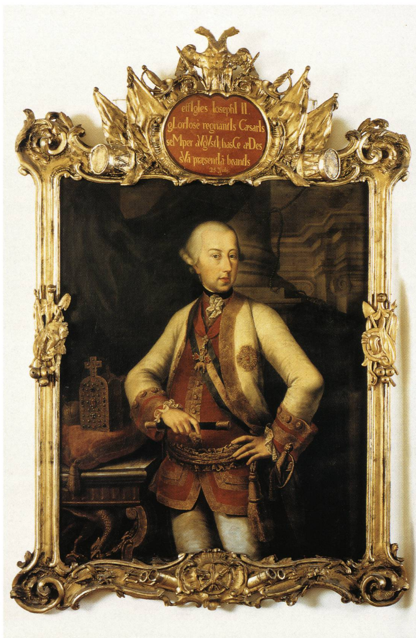
Abb. 5: Kaiser Joseph der II. Im Fricktal sind noch verschiedene Portraits des Kaisers vorhanden, wie dieses in Rheinfelden. Mit ihnen ist die Erinnerung an die österreichische Herrschaft wach geblieben.

keit. Als Frevel galten leichtere Vergehen wie Rauf- oder Schelthändel, unerlaubtes Holzschlagen oder Verletzung der Flurordnung, etwa wenn unbewachtes Vieh Schaden auf den Feldern anrichtete. Über solche Vergehen zu richten, stand zwar ausschliesslich dem Kastvogt oder später den Amtsleuten der Herrschaft Rheinfelden zu. Doch musste der Meier des Stifts dabei anwesend sein und durfte zwei Drittel der Bussen für sich beanspruchen. Diese Aufteilung der Bussengelder war öfters Anlass zum Streit zwischen den beiden Herrschaften, wie unten noch gezeigt wird. 13