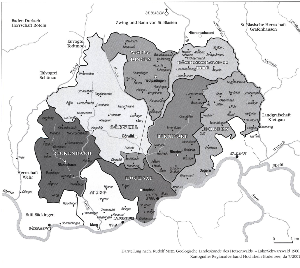
Abb. 1: Die Herrschaft Hanenstein gliederte sich in acht Einungen. Die Gebietsinheiten entstanden meist auf der Grundlage mittelalterlicher Grossparzellen und verfügten über verschiedene Sonderrechte und Strukturen der Selbstverwaltung.

Darstellung nach: Rudolf Metz: Geologische Landeskunde des Hotzenwalds. – Lahr/Schwarzwald 1980. Kartografie: Regionalverband Hochrhein-Bodensee, da 7/2001