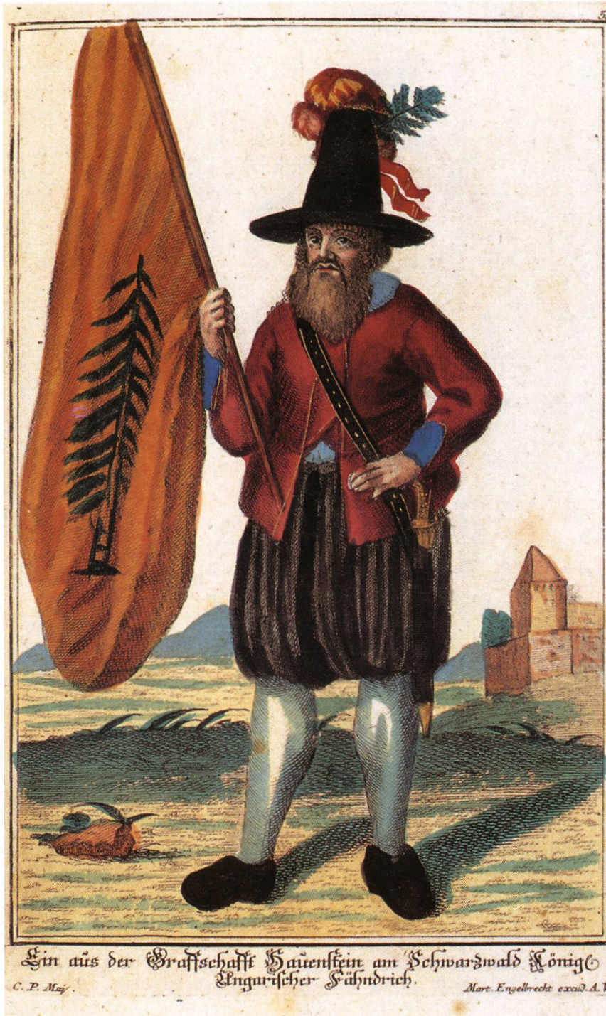
Abb. 5: Ein Fähnrich aus der Herrschaft Hauenstein mit dem landestypischen Gupfenhut. Die Waldfahne zeigt eine bewurzelte Tanne, die im 18. Jahrhundert auch auf Siegeln und Grenzsteinen des habsburgischen Verwaltungsgebietes erscheint. Die wehrfähige Bevölkerung der Einungen war im «Landfahnen» zusammengefasst. Dieses Milizaufgebot diente zunächst dem Schutz des Gebietes zwischen Rhein und Hochschwarzwald, wurde aber von den Landesfürsten bis in die frühe Neuzeit auch zur Waffenhilfe ausserhalb der Herrschaft Hauenstein herangezogen.

Landmiliz aufgelöst und durch ein stehendes Heer ersetzt. Die von den Freiburger Behörden anerkannte Bereitschaft der hauensteinischen Einheiten, sich für das hochpreisliche Erzhaus Österreich mit Gut und Blut einzusetzen, trug dazu bei, dass die Einungen ihre angestammten, von vielen Kaisern und Erzherzogen von Österreich ertheilten und bishero allergnädigst confirmierten Privilegien teilweise bis 1805 wahren konnten. 13