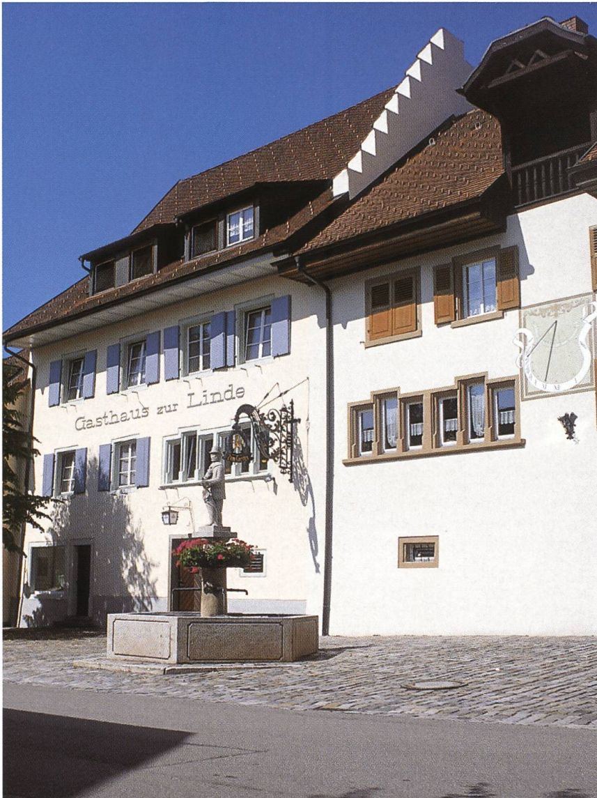
Abb. 3: Dogern war neben dem zentral gelegenen Görwihl DE einer der beiden Hauptorte der Herrschaft Hauenstein. Aufgrund der Nähe zum Sitz des Waldvogtes in Waldshut und der guten verkehrsmässigen Erschliessung trafen sich hier Redmann und Einungsmeister regelmässig zu Beratungen.

jeden Monat zur Besprechung aktueller Fragen. Dabei diente ihnen die Tavernenwirtschaft Zum Greifen und ab den frühen Sechzigerjahren des 18. Jahrhunderts der Gasthof Zum Hirschen als Tagungslokal (Abb. 2). Während in jeder Einung unter der Alb auch ein herrschaftlicher Vogt eingesetzt war, standen Dogern und Birndorf sowie Wolpadingen und Höchenschwand unter gemeinsamer Verwaltung eines landesfürstlichen Vertreters. Die Vögte verkündeten obrigkeitliche Erlasse, zogen bestimmte Gebühren ein und gaben die Vorladungen zu Gerichtsterminen bekannt. Diese Beamten wurden durch den Waldvogt ernannt, der dabei aber das Vorschlagsrecht der betreffenden Einungsmeister berücksichtigen musste. Durch die weitgehende Selbstverwal-