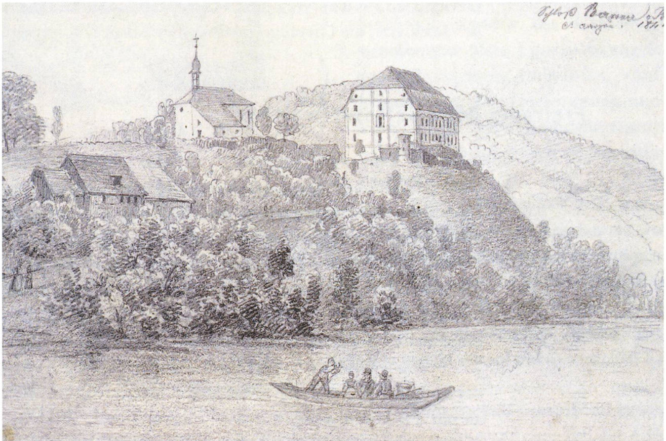
Abb. 6: Im Gasthaus «Zur Klemme» fanden sich regelmässig Anhänger der Salpetererbewegung ein. Das Anwesen lag unweit des Schlosses Bernau CH, nahe der Landesgrenze zwischen der eidgenössischen Grafschaft Baden und der vorderösterreichischen Kämmerherrschafft Laufenburg und war mit dem Schiff vom rechten Rheinufer aus leicht zu erreichen. Zeichnung von Heinrich Triner, um 1840.