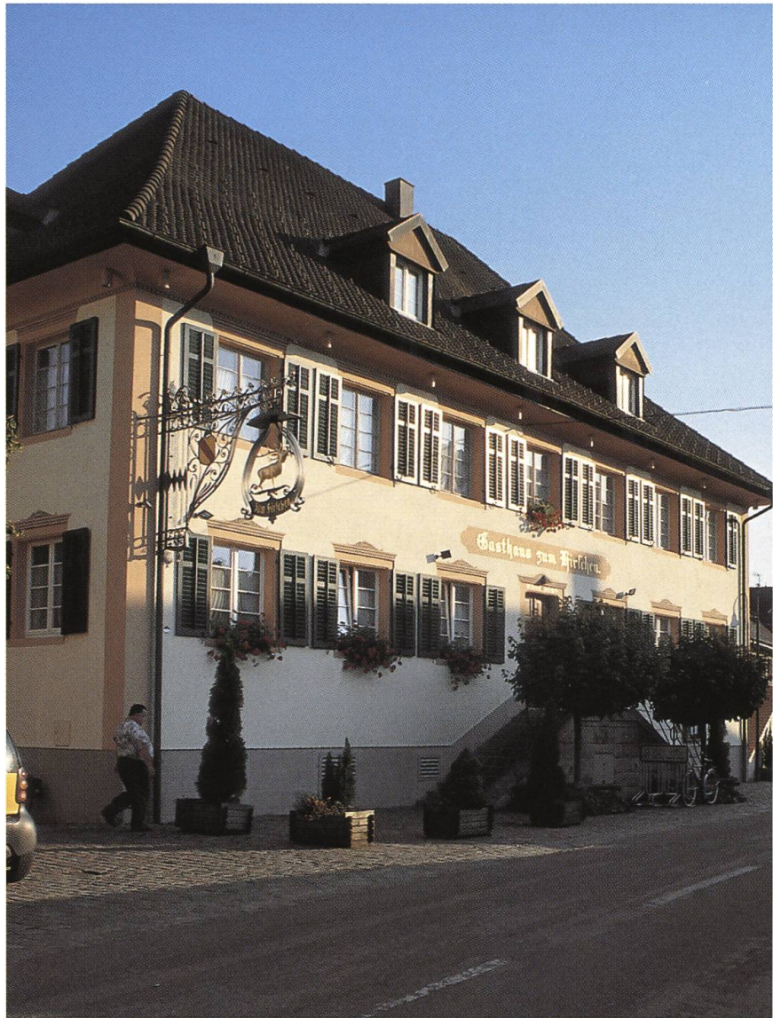
Abb. 2: Im Gasthaus «Zum Hirschen» in Dogern DE wurde in der zweiten Hälfte des 18. Jahrhunderts die Landeslade der Hauensteiner Einungen verwahrt. Die Truhe, die zuvor im feuersicheren Keller der Taverne «Zum Greifen» (heute Gasthaus zur Linde) untergebracht war, enthielt vor allem unterschiedliche Archivalien. Dazu zählten insbesondere Steuerbücher und verbriefte Rechte.

die Interessen der Landesfürsten wahrzunehmen. 5