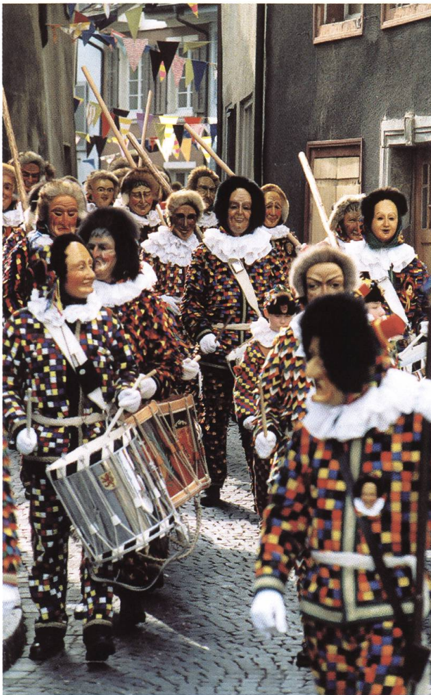
Abb. 1: Der Laufener Narro-Lauf.

festlichen und ausgelassenen Anlässen verbunden wurde. Mit der Herstellung der weit verbreiteten Fasnachtsküchlein verwertete man Eier, Fett und Schmalz. Bereits um 1430 nannte der aus Laufenburg stammende Dichter Heinrich von Laufenberg die vastnaht kuechli , die im heißen Fett schwimmend zubereitet werden. Wahrscheinlich leiten sich von dieser fettigen Speise die Bezeichnungen Faisse und Schmutzige Dunnschtig , wie in unserem Gebiet die Fasnachtsdonnerstage heißen, ab, wobei faiss fettig bedeutet und Schmutz ein alter Ausdruck für Fett darstellt. 4 Im Laufe des Spätmittelalters erfuhren in der Fasnachtszeit Verkleidungen, Masken und Lärmumzüge vor allem in den Städten eine zunehmende Beliebtheit. Allmählich wurde die Vermummung an der Strassenfasnacht üblich, wobei neben Hexen und Teufeln lokale Sagengestalten zu Fasnachtsfiguren wurden, so wie heute noch