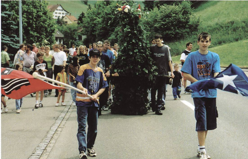
Abb. 6: Ein Sulzer Pfingstsprützlig.