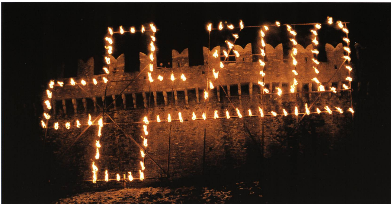
Abb. 3: Im Rahmen der Feierlichkeiten 700 Jahre Eidgenossenschaft präsentierten die Wittnauer CH 1991 in Bellinzona vor historischer Kulisse ein mit Feuer dargestelltes Jubiläumssujet. Symbole, Wörter und Jahreszahlen aus Feuer sind ein Merkmal des Wittnauer Brauchtums an der Alten Fasnacht.

ausleuchten (Abb. 3). Die seit dem letzten Funkensonntag verheirateten Paare aus dem Dorfe versorgen jeweils die Helfer mit Speis und Trank. 11