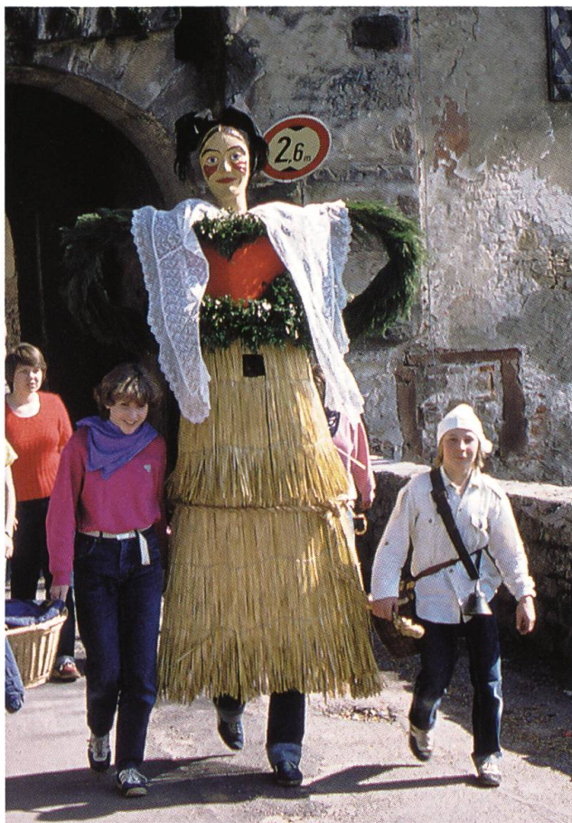
Abb. 4: Der Miesme aus Karsau DE.