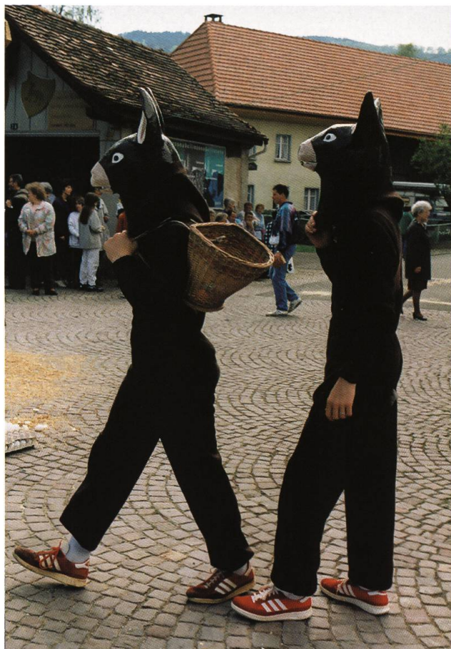
Abb. 5: Randgestalten des Wölflinswiler Eierlesens.